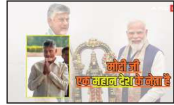
मोदी जी एक वादावदी नेता हैं

अगर 1947 से 1952 तक के उस दौर को भी जोड़ा जाए, जब जवाहरलाल नेहरू बिना आम चुनाव के प्रधानमंत्री थे, तो उनका कुल कार्यकाल 6,131 दिनों का बनता है. इसलिए कुल कार्यकाल के मामले में नेहरू अब भी आगे हैं।