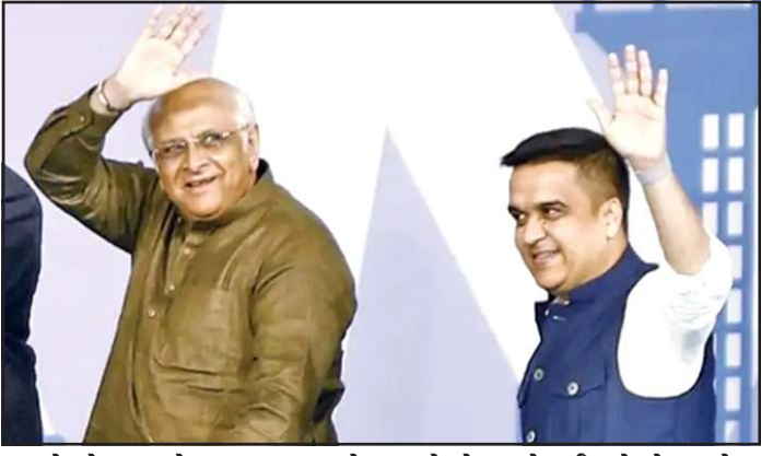
રહ્યું છે. જેના કારણે હાલ આ પ્રવાસને વિશેષ મહત્વ આપવામાં આવી રહ્યું છે. પ્રવાસ દરમિયાન વડાપ્રધાન નરેન્દ્ર મોદી ના વડાપ્રધાન તરીકેના ૧૨ વરસ પૂર્ણ થવાના અવસરે યોજનારા વિશેષ કાર્યક્રમોમાં પણ ગુજરાતના પ્રતિનિધિ મંડળની હાજરી રહેવાની સંભાવના છે. સાથે જ કેન્દ્રીય ગૃહ મંત્રી રાખવામાં આવી હોવાનું જાણવા મળી

પ્રતિનિધિ, ગાંધીનગર ગુજરાતના મુખ્યમંત્રી ભુપેન્દ્ર પટેલ અને ગૃહરાજ્ય મંત્રી હર્ષ સંઘવીના દિલ્હી પ્રવાસને લઈને રાજકીય વર્તુળોમાં ચર્ચાઓ તેજ બની છે. નાયબ મુખ્યમંત્રી પહેલે થી જ દિલ્હી પહોંચી ગયા છે. જ્યારે મુખ્યમંત્રી પણ ટુંક સમયમાં એટલે કે આજે મંગળવારે રાજધાની પહોંચે તેવી શક્યતા છે. આગામી બે દિવસ દરમિયાન યોજનારી વિવિધ મહત્વપૂર્ણ બેઠકો અને કાર્યક્રમોમાં ગુજરાત સરકાર સક્રિય ભાગ લેશે, દિલ્હી પ્રવાસને કારણે મુખ્યમંત્રીની જનસંપર્ક અને જનપ્રતિનિધિઓ સાથેની કેટલીક નિર્ધારિત મુલાકાતો સ્થગિત કરવામાં આવી છે. ઉપરાંત રાજ્ય કેબિનેટની નિર્ધારિત બેઠક પણ હાલ મોકુફ રાખવામાં આવી હોવાનું જાણવા મળી