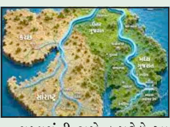
મુખ્યમંત્રી ભુપેન્દ્ર પટેલે આ રજુઆતોનો સકારાત્મક પ્રતિસાદ આપતા નર્મદા યોજનાના વરીષ્ઠ અધિકારીઓની એક ઉચ્ચસ્તરીય બેઠક તાત્કાલીક બોલાવીને નર્મદા

પ્રતિનિધિ, ગાંધીનગર મુખ્યમંત્રી ભુપેન્દ્ર પટેલે રાજ્યના ખેડુતોના વિશાળ હિતમાં આવતી કાલે તારીખ ૧૧ જુન ગુરુવાર થી નર્મદા નહેરોમાંથી સિંચાઈ માટે પાણી છોડવાનો મહત્વપૂર્ણ નિર્ણય લીધો છે. નર્મદા કમાન્ડ વિસ્તારના ધારાસભ્યો અને સાંસદોએ સિંચાઈ માટે વહેલુ પાણી છોડવાની મુખ્યમંત્રી સમક્ષ રજુઆતો કરી હતી.