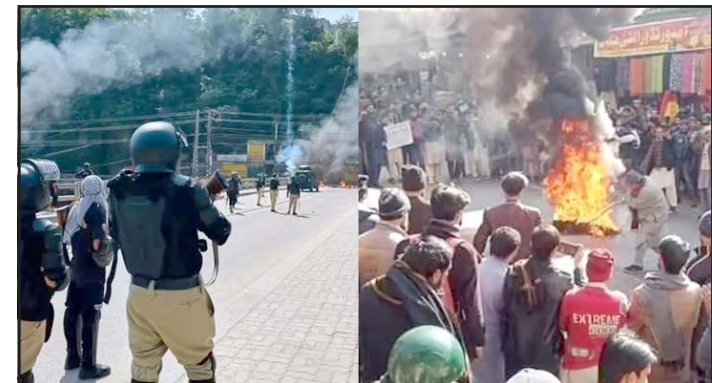
લોકોને જેલમાં ધકેલી દીધા હતા અને કેટલાય લોકોના જીવ લીધા હતા. પાકિસ્તાન સેના અત્યારે પોતાના જ રહી છે. કબ્જા હેઠળના લોકો પર જુલમ ગુજારીને આ વિદ્રોહને દબાવવાનો પ્રયાસ કરી રહી છે.

સેવાઓ સંપૂર્ણપણે ઠપ કરી દીધી છે, જેથી લોકો એકબીજા સાથે સંપર્ક ન કરી શકે. પાકિસ્તાનની શાહબાઝ શરીફ સરકાર અને આર્મી ચીફ અસીમ મુનીરને આ હિંસાનો અંદાજો પહેલાથી જ હતો. આથી જ સરકારે એક ટ્રાવેલ એડવાઈઝરી જાહેર કરીને પ્રવાસીઓને ૫ જૂનથી ૨૦ જૂન વચ્ચે PoKનો પ્રવાસ ન કરવાની કડક સલાહ આપી દીધી હતી. PoKમાં આ પ્રકારનો જનઆક્રોશ કોઈ પહેલીવાર જોવા નથી મળ્યો. આ