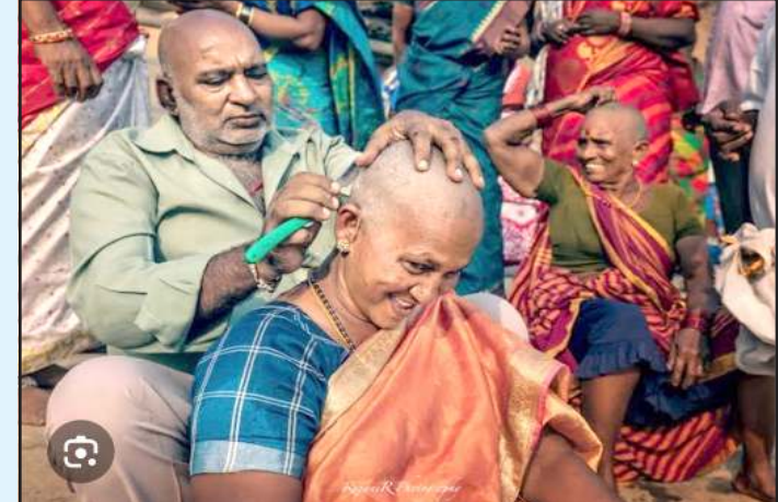
બાલાજી તરીકે પણ કહેવાતા ભગવાન વેંકટેશ્વરને વાળ ચડાવવાની પરંપરા ગરમીની સિઝનમાં ખૂબ વધી ગઈ છે. ગયા મહિનાના પહેલા ૨૭ દિવસમાં જે સંખ્યામાં ભક્તોએ માથું મૂંડાવ્યું એનાથી દુનિયાના

(છગનલાલ મેવાડા ધ્વારા) સુરત આંદ્ર પ્રદેશમાં આવેલા વિશ્વના સૌથી ધનાઢ્ય મંદિર તિરુમાલામાં પહેલી મેથી ૨૭ મેની વચ્ચે ૧૨,૪૩,૦૬૩ ભક્તોએ મુંડન કરાવીને પ્રભુને પોતાના વાળ ચડાવ્યા હતા. આ આંકડો ગયા બે વર્ષના મે મહિનાના મુંડન કરતાં ઘણો વધારે છે. ૨૦૨૫ના મે મહિનામાં ૧૦,૧૮,૩૭૦ ભક્તોએ અને ૨૦૨૪ ના મે મહિનામાં ૧૦,૬૫,૭૨૮ ભક્તોએ મુંડન કરાવ્યું હતું. બોલચાલમાં તિરુપતિ