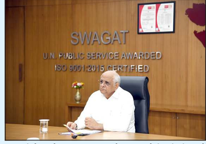
સલામતીનો અહેસાસ કરાવવા પોલીસ તંત્રને પણ સુચના આપી હતી. બોટાદ જિલ્લાના એક અરજદારની ભેટની જમીનમાં હયાતીમાં હક દાખલ કરવા અને હક્ક કમીની નોંધ પ્રમાણિત કરવા સંબંધિત મુદ્દે અગાઉ થયેલી વહીવટી ભૂલને કારણે અરજદારને સ્ટેમ્પ ડ્યુટીનો બોજ ન પડે તે માટે લોકાભિમુખ અભિગમ દાખવવા મુખ્યમંત્રીશ્રીએ જિલ્લા વહીવટી તંત્રને યોગ્ય કાર્યવાહી કરવાની સ્વરિત સુચના આપી હતી.

મુખ્યમંત્રી શ્રી ભૂપેન્દ્ર પટેલે રાજ્ય સ્વાગત અંતર્ગત આવતી રજૂઆતોનો સમય મર્યાદામાં ન્યાયિક અને સરળ રીતે નિરાકરણ લાવીને પ્રજાનો સરકાર પ્રત્યેનો વિશ્વાસ વધુ સંગીન થાય તેવી કામગીરીના જિલ્લા તંત્રને દિશા નિર્દેશ આપ્યા છે. આ સંદર્ભમાં તેમણે સ્પષ્ટ પક્ષે જણાવ્યું કે, જો કોઈપણ રજૂઆત કર્તાનું કામ નિયમનુસાર થવા પાત્ર હોય તો તાત્કાલિક તે પૂરું કરી આપવું જોઈએ. એટલું જ નહીં જો નિયમ મુજબ કામ થઈ શકે તેમ ન જ હોય તો સંબંધિત યુક્તિને વારંવાર કચેરીના ધક્કા ભવડાવવાને બદલે તાત્કાલિક અને સ્પષ્ટ જવાબ પાઠવી દેવો જોઈએ. મુખ્યમંત્રીશ્રીએ મે-૨૦૨૬ મહિનાના રાજ્યકક્ષાના સ્વાગત ઓનલાઈન જન ફરિયાદ નિવારણ કાર્યક્રમમાં પ્રત્યક્ષ રજૂઆતો લઈને આવેલા સામાન્ય માનવીઓની રજૂઆતો સંવેદના પૂર્વક સાંભળી હતી. સામાન્યતઃ દર મહિનાના ચોથા ગુરુવારે યોજવામાં આવતો આ રાજ્યસ્વાગત આ વખતે મે મહિનાના ચોથા ગુરુવારે જાહેર રજાને પરિણામે શનિવારે યોજાવામાં આવ્યો હતો. આ રાજ્ય સ્વાગતમાં ૨૧ પથી વધુ અરજદારો પોતાની રજૂઆતો સાથે મુખ્યમંત્રી કાર્યાલયના જનસંપર્ક એકમમાં ઉપસ્થિત રહ્યા હતા. જિલ્લા સ્વાગતમાં ૧૫૩૧ અને તાલુકા સ્વાગતમાં ૨૨૭૪ સહિત સમગ્રતયા ૪૦૨૦ અરજદારોની રજૂઆતો અંગે સંબંધિત વિભાગને જરૂરી કાર્યવાહી માટે મોકલવામાં આવી હતી.