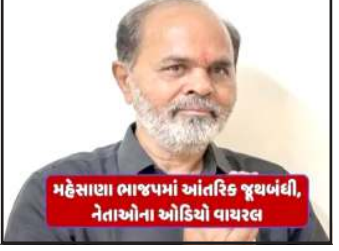
મહેસાણા ભાજપમાં આંતરીક જુથબંધી, નેતાઓની ઓડીયો વાયરલ

પ્રતિનિધિ, ગાંધીનગર મહેસાણા જિલ્લામાં છેલ્લા કેટલાક સમયથી ભાજપમાં આંતરીક જુથબંધી અને વિખવાદ હોવાનું બહાર આવ્યું છે. મહેસાણા જિલ્લામાંથી એક બાદ એક ભાજપના નેતાઓની કથિત ઓડીયો કિલવ બહાર આવી રહી છે. અગાઉ પૂર્વ નાયબ મુખ્યમંત્રી નિતેશ પટેલ અને રાજ્યસભા સાંસદ મયંક નાયક વિશે ટીપ્પણીઓની ઓડીયો વાયરલ થયા બાદ હવે નીજી ઓડીયો કિલવ બહાર આવી છે.