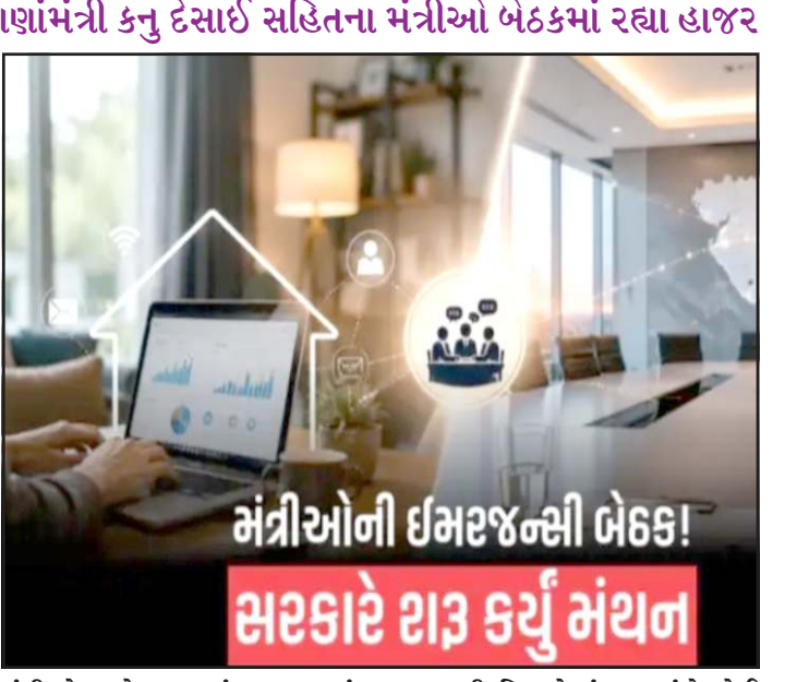
મંત્રીઓ વચ્ચે સઘન મંથન થયું હતું. આગામી દિવસોમાં આ અંગે કોઈ કર્મચારીઓની આ રજૂઆતોને સકારાત્મક રીતે જોઈને સરકાર

સરકારી નિવાસસ્થાને મળી હતી. જેમાં રાજ્ય સરકારના અનેક સીનીયર મંત્રીઓ ખાસ ઉપસ્થિત રહ્યા હતા. બેઠકમાં વર્તમાન સ્થિતિ પડકારો, વિવિધ સંગઠનોની માંગણીઓ અને સરકારના આગામી સમયના સત્તાવાર કાર્યક્રમોના આયોજન અંગે વિગતવાર ચર્ચા વિચારણા કરવામાં આવી હતી. આ બેઠકનો મુખ્ય એજન્ડા વિવિધ સરકારી સંગઠનો અને કર્મચારી સંગઠનો તરફથી મળેલી વર્ક ફ્રોમ હોમ ની રજૂઆત હતી. સુત્રોના જણાવ્યા અનુસાર બદલાતી પરિસ્થિતિઓ અને ટેકનોલોજીના યુગમાં સરકારી કામગીરીને વધુ સુદૃઢ બનાવવા માટે આંશિક એટલે કે પાર્શિય વર્ક ફ્રોમ હોમ ની નિતી અપનાવવા અંગે