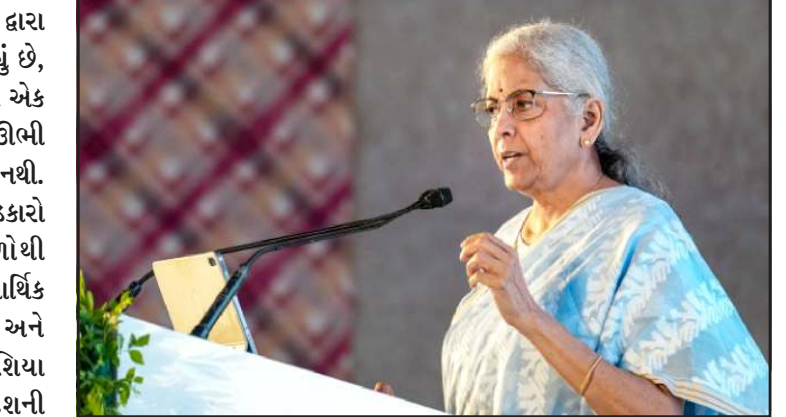
'MSMEs (સૂક્ષ્મ, લઘુ અને મધ્યમ ઉદ્યોગો) ના અટવાયેલા રૂ.૮.૧ લાખ કરોડની વિલંબિત ચૂકવણી તેમની કાર્યકારી મૂડી અને વૃદ્ધિને અસર કરી છે. જાહેર ક્ષેત્રના ઉપક્રમો (PSUs) ને MSMEs માટે નક્કી કરાયેલી ટપ દિવસની સમયમર્યાદામાં ચૂકવણી સુનિશ્ચિત થવી જોઈએ.'

તેમણે કહ્યું હતું કે, 'સામાન્ય લોકો દ્વારા જે કંઈ પણ સારું કામ કરાઈ રહ્યું છે, તેને ભૂલી જવામાં આવે છે અને એક નિરાશાવાદી, શંકાસ્પદ વાર્તા ઊભી ઘડી કઢાય છે, જે બિલકુલ યોગ્ય નથી. આપણે એ સમજવું જોઈએ કે પડકારો વધુ પ્રમાણમાં બાહ્ય પરિબળોથી પ્રેરિત છે. ભારતની સ્થાનિક આર્થિક સ્થિતિ આજે પણ હકારાત્મક અને સ્થિતિસ્થાપક છે. પશ્ચિમ એશિયા કટોકટી વચ્ચે કેટલાક લોકો દેશની પોતાની સિદ્ધિઓને ઓછી આંકવાનો પ્રયાસ કરી રહ્યા છે, જે યોગ્ય નથી.' નાણા મંત્રી સીતારામને નાણા ઉદ્યોગોની ચિંતા કરતા જણાવ્યું હતું કે,