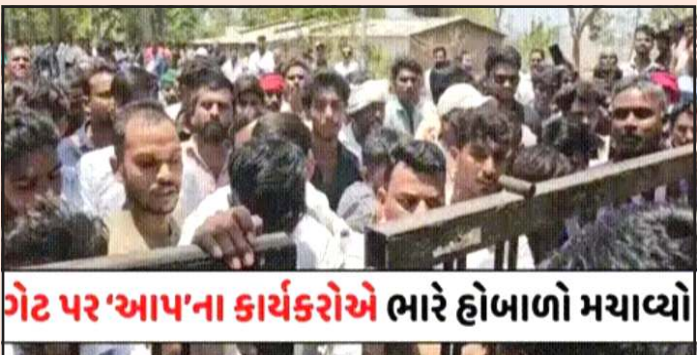
ગેટ પર આપના કાર્યકરોએ ભારે હોબાળો મચાવ્યો

પ્રતિનિધિ, ગાંધીનગર છોટા ઉદેપુર તાલુકા પંચાયતના પ્રમુખ અને ઉપપ્રમુખની ચુંટણી ભારે હંગામેદાર અને વિવાદાસ્પદ રહી હતી. પોલીસની કોલેજ કેમ્પસમાં આવેલી તાલુકા પંચાયત કચેરી ખાતે મતદાન કરવા પહોંચેલા આમ આદમી પાર્ટીના ૩ સભ્યોને પોલીસની હાજરીમાં જ બુકાનીધારીઓ ઉઠાવી ગયા હોવાનો સળગતો આક્ષેપ આમ આદમી પાર્ટી દ્વારા કરવામાં આવ્યો હતો. આ ઘટનાને પગલે કોલેજના ગેટે આમ આદમી પાર્ટીના કાર્યકરોએ ભારે હોબાળો મચાવ્યો હતો અને તંત્ર સામે આક્રોશ વ્યક્ત કર્યો હતો. જો કે આ તમામ આક્ષેપો અને વિવાદો વચ્ચે યોજાયેલી ચુંટણીમાં ભાજપે વિજય મેળવીને તાલુકા પંચાયત પર ભગવો લહેરાવ્યો હતો. છોટા ઉદેપુર તાલુકા પંચાયતમાં સત્તાનું ગણિત મુખ જ રસપ્રદ હતું. છોટા ઉદેપુર તાલુકા પંચાયતમાં કુલ બેઠકોમાંથી આમ