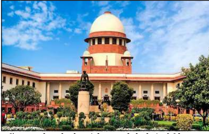
જો સરકારને નિમણૂકની રીત બદલવી યોગ્ય લાગે તો તે તેના અધિકાર, સત્તા અને ક્ષમતાના દાયરામાં હતું. જ્યાં સુધી આ બદલેલી નીતિ મનમાની સાબિત ન થાય ત્યાં સુધી કર્મચારી તે પદ પર દાવો કરી શકે નહીં. અત્રે જણાવવાનું કે આ કેસ ઓડિશા પરિવહન વિભાગમાં કર્મચારીઓના પ્રમોશન સંબંધિત હતો. આ અગાઉ ઓડિશા હાઈકોર્ટે રાજ્ય સરકારને જૂના નિયમો હેઠળ જ કર્મચારીઓના પ્રમોશન પર વિચાર કરવાનો નિર્દેશ આપ્યો હતો. સુપ્રીમ

(સંપૂર્ણ સમાચાર સેવા) નવી દિલ્હી સુપ્રીમ કોર્ટે કહ્યું કે સરકારી કર્મચારીઓ પાસે જૂના સેવા નિયમો હેઠળ પદોત્તરિ (પ્રમોશન) માંગવાનો કોઈ નિશ્ચિત (સહજ) અધિકાર હોતો નથી. ચુકાદામાં કોર્ટે કહ્યું કે જ્યાં જૂના સેવા નિયમો સમયે ખાલી પડી હતી તેના કારણે થઈને સરકારી કર્મચારીઓને એ આધાર પર પ્રમોશનનો હક મળતો નથી. સર્વોચ્ચ અદાલતે કહ્યું કે સરકાર કઈ પણ ચરણમાં નવા સેવા નિયમ લાવીને પસંદગી અને પદોત્તરિની પદ્ધતિ અને પ્રક્રિયામાં ફેરફાર કરવા માટે સક્ષમ છે, પણ શરત એ કે તે મનમાની રીતે ન હોય. જસ્ટિસ દીપાંકર દત્તા અને ઓગસ્ટીન જ્યોર્જ મસીહની પીઠે હાઈકોર્ટના ચુકાદા વિરુદ્ધ ઓડિશા સરકારની અપીલ સ્વીકારતા આ ચુકાદો આપ્યો. સુપ્રીમ કોર્ટની પીઠે કહ્યું કે કોઈ પણ કર્મચારી પાસે ન તો પ્રમોશન મેળવવાનો કોઈ સહજ અધિકાર હોય છે કે ન તો તેને પ્રમોશનની કોઈ કાયદેસર અપેક્ષા પ્રાપ્ત હોય છે. પીઠે સ્પષ્ટ કર્યું કે કર્મચારીનો ફક્ત પોતાની ઉમેદવારી પર વિચાર કરવો એ એકમાત્ર સીમિત અધિકાર હોય છે. જો કે પીઠે કહ્યું કે જો સરકાર, જે નિમણૂક અધિકારી છે, તે પોતાના વિવેકથી એ નિર્ણય કરે કે ખાલી જગ્યાઓને પ્રમોશન દ્વારા નહીં ભરવામાં આવે (ખાસ કરીને ત્યારે જ્યારે કેડરમાં ફેરફાર અને પદોનું પુનર્ગઠન થયું હોય) તો તેને નિમણૂક કરવા માટે બાધ્ય કરી શકાય નહીં. સુપ્રીમ કોર્ટે કહ્યું કે જ્યાં સુધી વર્તમાન મામલાનો સવાલ છે તો તેમાં સહાયક ક્ષેત્રીય પરિવહન અધિકારીનું પદ પસંદગીવાળું પદ હતું, પ્રમોશનવાળું નહીં. આ સાથે જ તેમણે કહ્યું કે નિમણૂકની રીત એક નીતિગત મામલો છે, જે સંપૂર્ણ રીતે સરકારના અધિકાર ક્ષેત્રમાં આવે છે. પીઠે કહ્યું કે