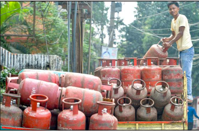
સુધી મોટો સકારાત્મક બદલાવ લાવી શકે છે. આ સ્વદેશી ટેકનોલોજી અપનાવવાથી ભારતને આશરે ૪.૦૪ અબજ ડોલર એટલે કે અંદાજે ૩૪,૨૦૦ કરોડ રૂપિયાની કોરેન કરન્સી બચાવવામાં મોટી મદદ મળી શકે છે. હાલના સમયમાં આ પગલું મૂખ જ મહત્વનું માનવામાં આવી રહ્યું છે, કારણ કે પશ્ચિમ એશિયામાં યુદ્ધની સ્થિતિ અને વૈશ્વિક તણાવને કારણે આંતરરાષ્ટ્રીય સ્તરે એલપીજીના સપ્લાય અને કિંમતો પર સતત દબાણ વધી રહ્યું છે. ડીએમઈ બનાવવાની પ્રક્રિયા પણ એકદમ અધુનિક છે. આમાં કોલ ગેસિકેશન ટેકનોલોજી દ્વારા પહેલા કોલસાને સિન્થેટિક ગેસમાં બદલાવવામાં આવે છે અને ત્યારબાદ તેમાંથી ડીએમઈ તૈયાર થાય છે. વૈજ્ઞાનિકોના મતે, ડીએમઈ જ્યારે સળગે છે ત્યારે પરંપરાગત હાઈડ્રોકાર્બન ઈંધણની તુલનામાં મૂખ જ ઓછું પ્રદૂષણ

ઈન્ડસ્ટ્રિયલ ફ્યુઅલ (ઓઘોગિક બળતણ) તરીકે થઈ શકે છે. રાહતની વાત એ છે કે, શરૂઆતના તબક્કામાં ૨૦ ટકા ડીએમઈ અને ૮૦ ટકા એલપીજીના મિશ્રણનો ઉપયોગ કરવાની યોજના છે, જેના કારણે સામાન્ય લોકોને પોતાના વર્તમાન ગેસ ચૂલા કે સિલિન્ડર બદલવાની કોઈ જરૂર નહીં પડે. વૈજ્ઞાનિકોનું કહેવું છે કે ડીએમઈનો ઉપયોગ માત્ર રસોડા પૂરતો મર્યાદિત નહીં રહે, પરંતુ એલપીજીથી ચાલતી ઓટો રિક્ષામાં પણ ઈંધણ તરીકે આનો ઉપયોગ કરી શકાશે. એટલે કે, આ નવી ટેકનોલોજી ઘરેલું ગેસથી લઈને ટ્રાન્સપોર્ટ સેક્ટર