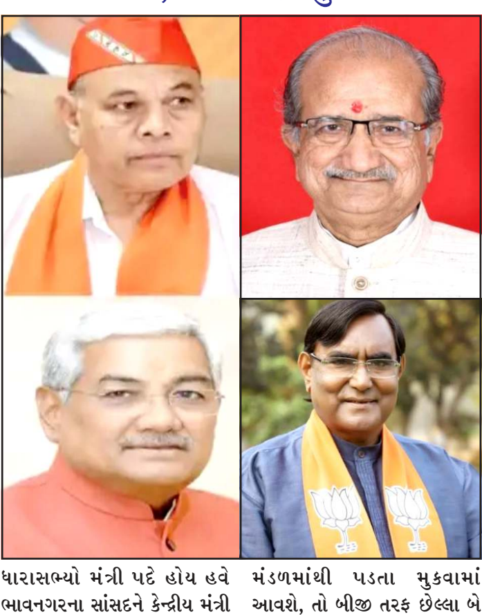
ધારાસભ્યો મંત્રી પદે હોય હવે ભાવનગરના સાંસદને કેન્દ્રીય મંત્રી મંડળમાંથી પડતા મુકવામાં આવશે, તો બીજી તરફ છેલ્લા બે

પ્રતિનિધિ, ગાંધીનગર ભાજપના રાષ્ટ્રીય અધ્યક્ષ નિતીન નબીન દ્વારા હવે ટુંક સમયમાં સંગઠનનું માળખું જાહેર કરવામાં આવે તેવી શક્યતા હાલ દેખાય રહી છે. જેમાં ગુજરાતના ૩ થી ૪ નેતાઓને રાષ્ટ્રીય સંગઠનમાં સ્થાન આપવામાં આવે તેવી શક્યતા હાલ દેખાય રહી છે. આવતા મહિને ગુજરાતની રાજ્ય સભાની પણ ૪ બેઠકો ખાલી પડી રહી હોય જેમાં ગુજરાતના ભાજપના નેતાઓ માટે આગામી દિવસોમાં બહુ મોટી તક રહેલી છે. વડાપ્રધાન નરેન્દ્ર મોદી પોતાના મંત્રીમંડળનું પણ વિસ્તરણ કરી શકે છે, જો કે તેમાં ગુજરાતના કોઈ સાંસદનો સમાવેશ કરવામાં આવે તેવી શક્યતા મુખ્ય જ નહીવત છે. કારણ કે હાલ ગુજરાતના લોકસભા અને રાજ્યસભાના ૬ સાંસદો કેન્દ્ર સરકારમાં મંત્રી તરીકે જવાબદારી વહન કરી રહ્યા છે તે પૈકી ૫ સાંસદો