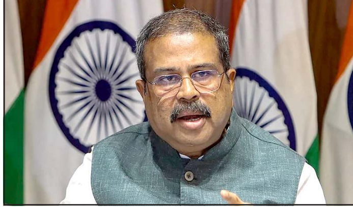
સરકારે તત્કાલ સીબીઆઈને તપાસ સોંપી. આ વખતે સીબીઆઈ ઉડાણ સુધી જશે અને ગેરરીતિની માહિતી મેળવશે. મંત્રીએ કહ્યું કે

ત્યારબાદ પરીક્ષા રદ કરવામાં આવી જેથી કોઈ વિદ્યાર્થીએ મુશ્કેલીનો સામનો કરવો પડે નહીં. તેમણે કહ્યું કે આજે અમે નવી તારીખની સાથે આવ્યા છીએ. આજથી એક મહિના બાદ નવી પરીક્ષા યોજાશે. અમારો અપ્રોચ તે રહેશે. પરીક્ષા માહિયાઓની સાથે અમારી લડાઈ છે. વિવિધ સોશિયલ મીડિયા હેન્ડલ પર ભ્રમિત કરનાર તથ્યો રાખવામાં આવે છે, ગેરમાર્ગે દોરવાનો પ્રયાસ કરવામાં આવે છે, જેનાથી બચવું જરૂરી છે. તેવામાં