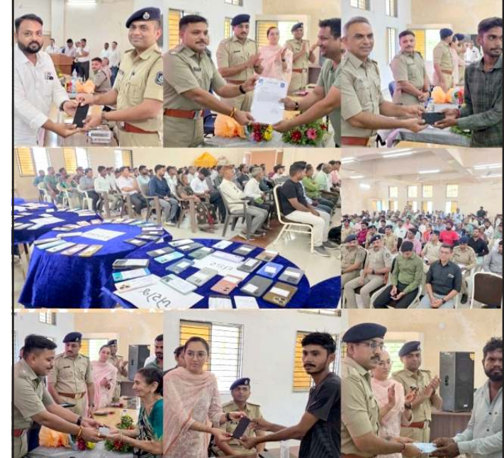
૧૧૬ મોબાઈલ રીકવર કરવામાં આવી હતા. આ રીકવર કરેલ ફોન માં ૪ ચોરી થયેલ ફોનોનો સમાવેશ થાય છે. આ સાથે સાઈબર કાર્ટમ પોલીસ