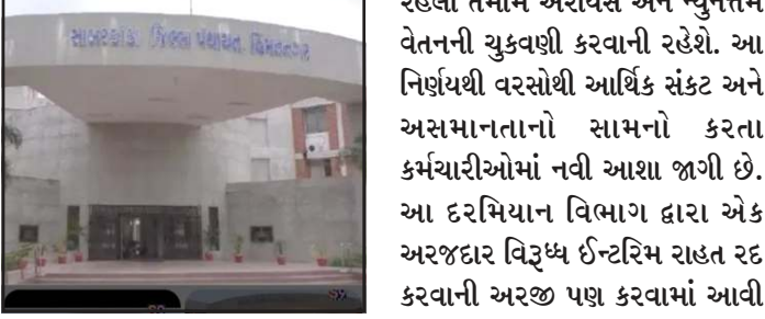
રહેલા તમામ એરીયર્સ અને ન્યુનતમ વેતનની ચુકવણી કરવાની રહેશે. આ નિર્ણયથી વરસોથી આર્થિક સંકટ અને અસમાનતાનો સામનો કરતા કર્મચારીઓમાં નવી આશા જાગી છે. આ દરમિયાન વિભાગ દ્વારા એક અરજદાર વિરૂધ્ધ ઈન્ટરિમ રાહત રદ કરવાની અરજ પણ કરવામાં આવી હતી. પરંતુ કોર્ટે દ્વારા તે અરજ નામંજૂર કરતા કર્મચારીઓનો પક્ષ વધુ મજબૂત બન્યો છે. હાલ કર્મચારીઓને નિયમિત કરવાની માંગણી સહિત અન્ય મુદ્દાઓ અંગેની સુનાવણી બાકી છે અને આગામી સુનાવણી તારીખ ૨૩ જુનના રોજ નિર્ધારિત કરવામાં આવી છે. હાઈકોર્ટના આ નિર્ણયને માત્ર પગારની લડતમાં જીત તરીકે નહીં પરંતુ કર્મચારીઓના હક્ક અને સન્માન આદેશ બાદ હવે સંબંધિત વિભાગને ડ્રાઈવર વર્ગના કર્મચારીઓને બાકી

પ્રતિનિધિ, ગાંધીનગર જિલ્લા પંચાયતના આરોગ્ય વિભાગ હેઠળ મોબાઈલ હેલ્થ યુનિટમાં લાંબા સમયથી ફરજ બજાવતા ડ્રાઈવર વર્ગના કર્મચારીઓ માટે રાહતભરા સમાચાર આવ્યા છે. વરસોથી ચાલી રહેલા પગાર અને સેવા સંબંધિત વિવાદમાં હાઈકોર્ટ તરફથી મહત્વપૂર્ણ નિર્ણય આવતા કર્મચારીઓમાં ખુશીની લાગણી વ્યાપી ગઈ છે. લાંબા સમયથી પોતાના હક્ક અને ન્યાય માટે લડત લડી રહેલા કર્મચારીઓને હવે બાકી રહેલા પગાર, એરીયર્સ તેમજ ન્યુનતમ વેતન મળવાનો માર્ગ મોકળો બન્યો છે. આ મામલો ત્યારે શરૂ થયો હતો જ્યારે વર્ષ ૨૦૧૪ માં એક આદેશ દ્વારા ડ્રાઈવર વર્ગના કર્મચારીઓના વધારેલા પગારને ૨૬ કરીને માત્ર રૂપિયા ૬ હજાર ફીક્સ વેતન નક્કી કરવામાં આવ્યું હતું. એટલું જ નહીં અગાઉ ચુકવવામાં આવેલી ૨૬મની વસુલાત કરવાની પ્રક્રિયા પણ શરૂ કરાઈ હતી. કર્મચારીઓએ આ નિર્ણયને અન્યાયપૂર્ણ અને બંધારણીય હક્કો વિરૂધ્ધ ગણાવી કાનુની લડત શરૂ કરી હતી. હાઈકોર્ટ પ્રાથમિક કર્મચારીઓએ વકીલ શિવાંગ શાહ મારફતે હાઈકોર્ટમાં અરજ દાખલ કરી પોતાની રજૂઆતમાં જણાવ્યું હતું કે વરસોથી આરોગ્ય સેવાઓમાં સતત ફરજ બજાવતા હોવા છતાં તેમને યોગ્ય વેતન અને લાભોથી વંચિત રાખવામાં આવ્યા છે. હાઈકોર્ટ પ્રાથમિક સુનાવણી દરમિયાન અરજદારોની દલીલને ધ્યાનમાં લઈ નોટીસ જારી કરી હતી અને હાલની સ્થિતિ જાળવી રાખવાનો આદેશ આપ્યો હતો. પછીથી કર્મચારીઓએ બાકી રહેલા પગાર અને સરકાર દ્વારા નક્કી કરાયેલા ન્યુનતમ વેતનની ચુકવણી માટે પણ અરજ કરી