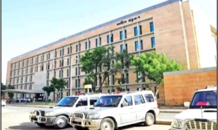
વધારવાનો છે. લાંબા સમયથી નબળી કામગીરી કરનાર અથવા બિન ઉત્પાદક કર્મચારીઓ સામે કાર્યવાહી માટે આ પ્રક્રિયા મહત્વપૂર્ણ માનવામાં આવી રહી છે. તમામ વિભાગોને ૩૦ મે ૨૦૨૬ સુધીમાં માહિતી મોકલવા સુચના આપવામાં આવી છે. માહિતીના આધારે રાજ્ય સરકાર આગામી સમયમાં યોગ્ય કાર્યવાહી કરી શકે છે.

પ્રતિનિધિ, ગાંધીનગર રાજ્ય સરકાર દ્વારા હવે જે કર્મચારીઓ ૫૫ વરસની ઉંમર વટાવી ચુક્યા હોય અને બિનકાર્યક્ષમ હોય તેવા કર્મચારીઓને ઘર ભેગા કરવાની સરકાર તૈયારી કરી છે. સરકાર દ્વારા એક પરીપત્ર જાહેર કરીને તમામ વિભાગો પાસેથી ૫૫ વરસ પૂર્ણ કરનારા કર્મચારીઓની ૧૧ મુદ્દાઓની વિગત મંગાવવામાં આવી છે. વિગતો મળ્યા બાદ સરકાર દ્વારા સમીક્ષા કરવામાં આવશે. જેમાં કોઈ કર્મચારીની કામગીરી સંતોષકારક નહી હોય, શિસ્તભંગના કેસ હોય અથવા ફરજ પ્રત્યે બેદરકારી જણાશે તો સરકાર એવા કર્મચારીઓને સમય પહેલા નિવૃત્ત કરી ઘરભેગા કરી શકે છે. હિસાબ અને તીજોરી નિયામક કચેરી દ્વારા જાહેર કરાયેલા પરીપત્ર અનુસાર ગૃપ-૧ થી ગૃપ-૪ સુધીના એવા કર્મચારીઓની વિગતો મંગાવવામાં આવી છે. જેઓ ૧ ઓક્ટોબર ૨૦૨૬ થી ૩૧ ડીસેમ્બર ૨૦૨૬ દરમિયાન ૫૫ વરસની ઉંમર પૂર્ણ કરતા હોય, સરકારે હવે આવા કર્મચારીઓના હેલ્થ કેટલાક વરસોના સેવા રેકોર્ડ, ગુપ્ત અહેવાલો, શિસ્તભંગની કાર્યવાહી અને કાર્યક્ષમતાનું મુલ્યાંકન કરશે. સરકારી સુત્રોના જણાવ્યા મુજબ સરકારનો મુખ્ય ઉદ્દેશ વહિવટી તંત્રમાં કાર્યક્ષમતા