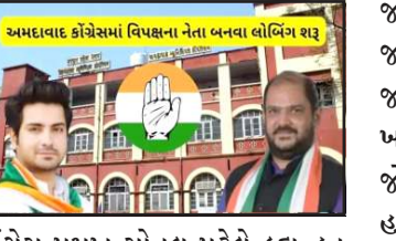
અમદાવાદ કોંગ્રેસમાં વિપક્ષના નેતા બનાવવાની ચર્ચા

પ્રતિનિધિ, ગાંધીનગર અમદાવાદ મહાનગરપાલિકામાં કોંગ્રેસનું પ્રદર્શન નિરાશાજનક રહ્યું છે, મેયર બનાવવાના સપના સેવતી કોંગ્રેસે હારે વિપક્ષના નેતા માટે કવાયત કરવાની છે, ચુંટાયેલા વર્તમાન ઉર કોર્પોરેટરમાંથી વિપક્ષના નેતા બનવા માટે જોરદાર લોબીંગ શરૂ થયું છે.