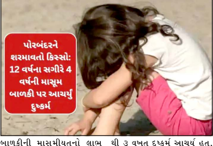
પોરબંદરને શરમાવતો કિસ્સો: 12 વર્ષના સગીરે 4 વર્ષની માસુમ બાળકી પર આચર્યું દુષ્કર્મ

પ્રતિનિધિ, ગાંધીનગર ગાંધીની જન્મભૂમિ એવા પોરબંદર શહેરમાંથી એક અત્યંત ચોંકાવનારી અને માનવતાને શરમાવે તેવી ઘટના બનવા પામી છે. શહેરના ઉદ્યોગનગર અને કમલાબાગ પોલીસ સ્ટેશન વિસ્તારની હદમાં પાડોશમાં રહેતા માત્ર ૧૨ વરસના એક સગીરે ૪ વરસની માસુમ બાળકી પર દુષ્કર્મ આચર્યું હોવાની વિગતો બહાર આવતા સમગ્ર પંચકમાં અરેરાટી ફેલાઈ ગઈ છે.