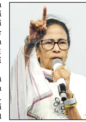
પ્લેબુક અગાઉ પણ જોઈ છે: મધ્ય પ્રદેશ, હરિયાણા, મહારાષ્ટ્ર, લોકસભા ૨૦૨૪ વગેરે.

ભાજપ મોદીની લહેરની ચરમસીમા પર નહોતું જીતી શક્યું. ૨૦૧૫ માં દિલ્હીમાં અને ૨૦૧૬માં બંગાળમાં તેમની ૩-૩ બેઠકો આવી હતી. તે જ દિલ્હી અને બંગાળમાં ભાજપે તેવા સમયે જીત હાંસલ કરી જ્યારે મોદીજીની લોકપ્રિયતા પાતાળમાં જઈ રહી છે. કેવી રીતે?