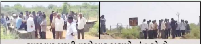
કાળઝાળ ગરમી વચ્ચે પાક સુકાયો: તંત્ર કહે છે, "કેનાલ બનાવવાનું જ ભુલાઈ ગયું"

પ્રતિનિધિ, ગાંધીનગર સુરેન્દ્રનગર જિલ્લા બેતી આધારીત જિલ્લા છે, જ્યાં ખેડુતો મુખ્યત્વે ઘઉં, કપાસ અને મગફળી જેવા પાક પર નિર્ભર છે, સરકારનો દાવો છે કે નર્મદા કેનાલનો સૌથી વધુ લાભ આ જિલ્લાને મળ્યો છે, પરંતુ વાસ્તવિકતા કંઈક અલગ જ ચિત્ર રજૂ કરે છે, વઢવાણ, ખારવા, બલદાણા અને ગોમટા જેવા ગામોના ખેડુતો માટે આ કેનાલ માત્ર શોભાના ગાંઠીયા સમાન સાબિત થઈ છે.