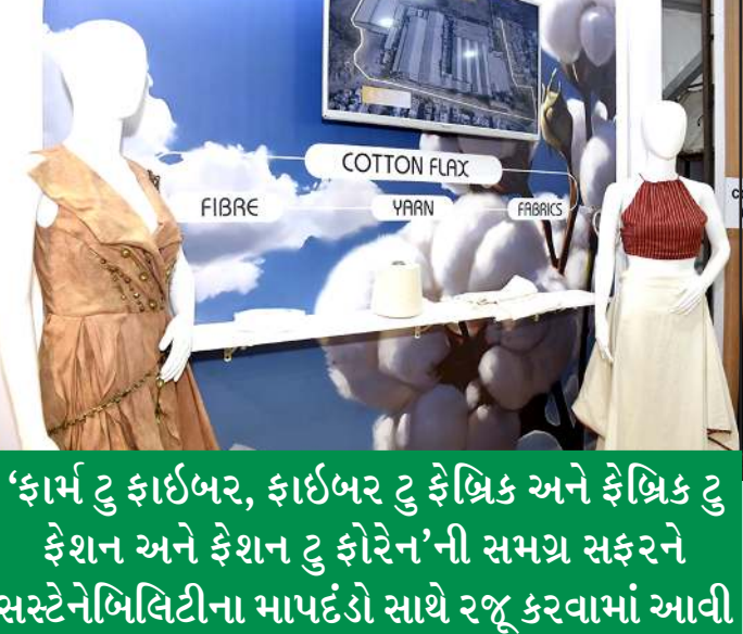
'ફાઈબર ટુ ફાઈબર, ફાઈબર ટુ ફેબ્રિક અને ફેબ્રિક ટુ ફેશન અને ફેશન ટુ ફોરેન'ની સમગ્ર સફરને સસ્ટેનેબિલિટીના માપદંડો સાથે રજૂ કરવામાં આવી

જાડેજાની આગેવાની હેઠળ વેપારીઓએ રાજકોટ જિલ્લા પુરવઠા અધિકારીને આવેદનપત્ર પાઠવી રજૂઆત કરી હતી કે રાજકોટ શહેર વ્યાજબી ભાવના દુકાનદાર એસોસિએશનના હોદ્દાદારો અને સભ્યો છીએ. સરકારની વિવિધ યોજનાઓ અંતર્ગત જનતાને અનાજ વિતરણ કરવાની જવાબદારી અમે નિકાપૂર્વક નિભાવી રહ્યા છીએ. કેન્દ્ર સરકારના હસ્તક આવતુ માર્ચ