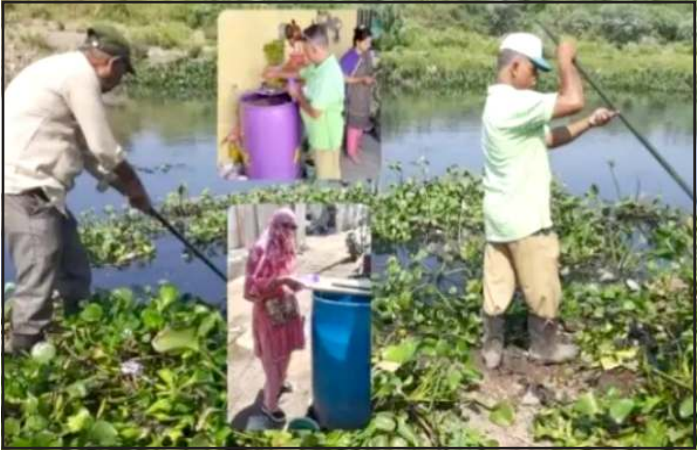
ચોકાવનારા છે. શહેરની વિવિધ હોસ્પિટલો અને ઓથોરિટીમાં નોંધાયેલા કેસો તરફ

પ્રતિનિધિ, ગાંધીનગર સ્માર્ટ સીટી રાજકોટમાં છેલ્લા એક અઠવાડિયાથી બિમારીના કેસોમાં નોંધપાત્ર ઉછાળો જોવા મળી રહ્યો છે. ગરમીનો પારો વધવાની સાથે જ અને પ્રદુષિત પાણીની ફરીયાદો વચ્ચે રાજકોટ શહેરમાં પાણીજન્ય અને મરછરજન્ય રોગચાળો વકર્યો છે.