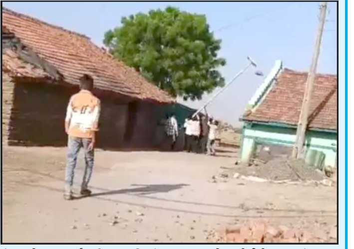
તંત્ર પાસે કડક કાર્યવાહી કરવાની માંગ ઉઠાવી છે. સ્થાનિક લોકોનું કહેવું છે કે ચુંટેણીમાં હારનો બદલો જનતાની સુવિધાઓ છીનવી લેવો તે કેટલાક અંશે યોગ્ય છે? આવા કૃત્યો સામે કડક પગલા લેવા જોઈએ. હાલમાં સમગ્ર મામલે પ્રશાસન શું કાર્યવાહી કરે છે તે જોવાનું રહેશે પરંતુ ઘટનાએ ગામમાં રાજકીય તણાવ વધારી દીધો છે.

હતી. આરોપ એવો લાગ્યો છે કે વિકાસના બીજ રોપનારી રાજકીય પાર્ટી ભાજપ હાર પચાવી ન શકતા, કિનાબોરી દાખવવામાં આવી છે, કેટલાક લોકોએ ગામમાં સરકારી ગ્રાન્ટ હેઠળ લગાડવામાં આવેલી સોલાર સ્ટ્રીટ લાઈટો ઉતારી લીધી હતી. આ લાઈટો ગામમાં ભરીને લઈ જવામાં આવી હોવાનો વિડીયો પણ વાયરલ થયો હતો. જેના કારણે ગામના કેટલાક વિસ્તારોમાં અંધારપટ છવાઈ જવા પામ્યો હતો.