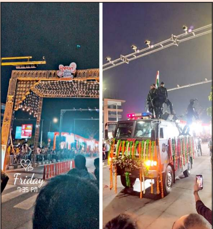
રાજ્યના મુખ્યમંત્રી ભુપેન્દ્રભાઈ પટેલ, રાજ્યના ગવર્નર આચાર્ય દેવવ્રતના અધ્યક્ષ સ્થાને દૈ માં ગુજરાત ગૌરવદિવસની ઉજવણી વાય-જંકશન સુરત ખાતે કરવામાં આવેલી. જે ગુજરાતની સમગ્ર જનતા માટે આનંદ અને ગૌરવની વાત છે. ગુજરાત રાજ્યના મુખ્યમંત્રીએ સફાઈ કર્મચારીઓની વિશાળ ઉપસ્થિતિમાં જે કાર્યક્રમ યોજાવામાં

(છગનલાલ મેવાડા ધ્વારા) સુરત ગુજરાત રાજ્યની સ્થાપના ૦૧ મે, ૧૯૬૦ ના રોજ થયેલ છે. મહાગુજરાત આંદોલન ધ્વારા મહારાષ્ટ્ર અને ગુજરાત રાજ્ય છૂટા પડયા. મહાગુજરાત આંદોલન ચળવળમાં નેતા ઈન્દુલાલ યાજ્ઞિક ધ્વારા ગુજરાત અને મહારાષ્ટ્ર છૂટા પડે તે માટે આંદોલન ચલાવવામાં આવી રહેલ હતું. અને તેમાં તેમણે ૧૯૬૦ ની ૧ મે એ સફળતા મળેલી. પરંમપૂજ્ય રવિશંકર મહારાજના વરદ હસ્તે સાબરમતી આશ્રમ અમદાવાદ ખાતે રાજ્યનો ઉદઘાટન કાર્યક્રમ રાખવામાં આવ્યો હતો. અને પ્રથમ મુખ્યમંત્રી તરીકે ડો. જીવરાજ મહેતાએ રાજ્યની ધૂરા સંભાળેલી. ત્યારબાદ આવેલા તમામ મુખ્યમંત્રીઓ ધ્વારા આજદિન સુધી ગુજરાત સ્થાપના દિવસની ઉજવણી કરવામાં આવી રહી છે. પ્રથમવાર સુરત શહેરના આંગણે સફાઈ કામદારોની વિશાળ હાજરીમાં ગુજરાત