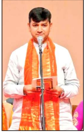
બનાસકાંઠા જિલ્લા પંચાયતની ડીસા તાલુકાના નેસડા ગામે બેઠક પર આવેલા પરીણામોએ રાજ્યના રાજકારણમાં ગરમાવો લાવી દીધો છે. નેસડા જીના સીટ પર કોંગ્રેસની આખી પેનલનો ભવ્ય વિજય થતા