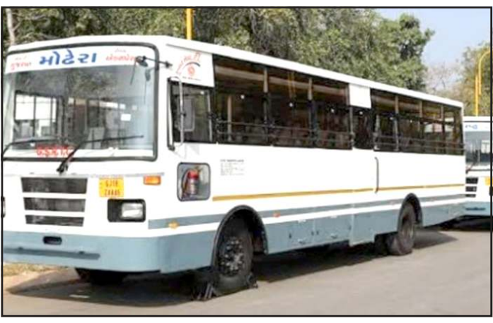
માર્ગ અપનાવશે તેવી નોટીસ પણ નિગમના એમડી ને પાઠવવામાં આવી છે. નિગમને પાઠવેલી નોટીસમાં યુનિયનોએ એમડી ને સંબોધીને જણાવ્યું છે કે હાલ નિગમ ખાતે ડ્રાઈવર-કંડક્ટરની ભરતી પ્રક્રિયા ખુબ જ જટીલ છે તેને સરળ બનાવવી જોઈએ, રાજ્યના જુદા જુદા (વિભાગ) વાઈઝ ડ્રાઈવર/કંડક્ટરની ભરતી કરવી જોઈએ. શૈક્ષણિક લાયકાત કરતા ડ્રાઈવિંગ સ્કેલને વધુ મહત્વ આપવું જોઈએ. સરકારમાંથી નિગમના કુલ ડ્રાઈવર/કંડક્ટરની જગ્યામાં લીવ રીઝર્વ સ્ટાફ રેશિયો

પ્રતિનિધિ, ગાંધીનગર જો ખાનગી કંપનીના કર્મચારીઓની ભરતી થશે તો રાજ્યવ્યાપી આંદોલનની યુનિયનોએ આપી ચીમકી સાથે એમડી ને નોટીસ પાઠવી, છેલ્લા કેટલાક વરસોથી એસટી નિગમમાં વિવિધ સેવાઓનું પાનગીકરણ થઈ રહ્યું છે. હાલમાં ચાલતી વોલ્વો-લકઝરી સહિતની પ્રિમિયમ સર્વિસોનો કોન્ટ્રાક્ટ પણ જુદી જુદી ખાનગી ટ્રાવેલ્સ કંપનીઓને અપાયેલો છે. ત્યારે હવે એસટી નિગમના સત્તાવાળાઓએ ડ્રાઈવર-કંડક્ટરોની ઘટ ને કારણે રાજ્યભરમાં ૨૫ ટકા થી વધુ કેન્સેલેશન માં ઘટાડો કરવા ખાનગી એજન્સી મારફતે ૨ હજાર થી વધુ ડ્રાઈવર-કંડક્ટરોને ભરતી કરવા તજવીજ હાથ ધરી છે. ત્યારે નિગમના સત્તાવાળાઓના આ વધુ એક ખાનગીકરણના નિર્ણય સામે એસટીના માન્ય ઉ કર્મચારીઓ યુનિયનોએ વિરોધ નો વંટોળ ઉભો કર્યો છે અને એમ ડી સાથે યોજાયેલી બેઠકનો બહિષ્કાર કરી જો નિગમ ખાનગી ધોરણે ડ્રાઈવર કંડક્ટરોની ભરતી કરશે તો યુનિયનો હડતાલનો