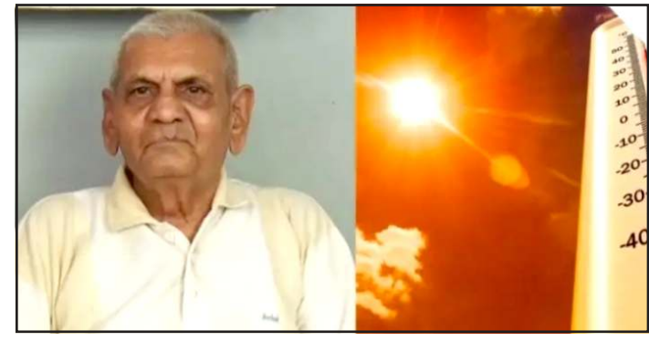
આગામી દિવસોમાં તાપમાનનો પારો હજુ ૨ થી ૩ ડિગ્રી ઉંચો જઈ શકે છે. ઉંચલા ૨૪ કલાકની જ વાત કરીએ તો રાજ્યના ૧૧ જેટલા શહેરોમાં તાપમાન ૪૦ ડિગ્રીને પાર પહોંચી ગયો છે. જેમાં અમરેલીમાં સૌથી વધુ ૪૩.૩ ડિગ્રી, રાજકોટમાં ૪૩.૧ ડિગ્રી અને સુરેન્દ્રનગરમાં ૪૩ ડિગ્રી જેટલું આકરૂં તાપમાન નોંધાયું હતું. આ ઉપરાંત અમદાવાદમાં ૪૨.૧, રહે-રહેદમાં ૪૧.૮, ગાંધીનગર અને વડોદરામાં ૪૧.૫, ભુજ માં ૪૧.૪, વલ્લભવિદ્યાનગર માં ૪૦.૮, ડીસામાં

પ્રતિનિધિ, ગાંધીનગર એપ્રિલ મહિનો પુરો થવા આવ્યો છે. ત્યારે આકાશમાંથી જાણે અગનવર્ષા થઈ રહી હોય તેમ આખુ ગુજરાત અગનભઠ્ઠીમાં ફેરવાઈ ગયું છે. એક તરફ કાળજાળ ગરમી પડી રહી છે. તો બીજી તરફ આજે લોકશાહીના પર્વ સમાન મતદાનનો દિવસ છે. હવામાન વિભાગ અને જાણીતા હવામાન નિષ્ણાંત અંબાલાલ પટેલે આગાહી કરી છે કે હજુ આવનારા દિવસોમાં ગરમીનું આ ટોચર વધુ આકરૂં બનવાનું છે. તેથી મતદાતાઓએ અને સામાન્ય જનતાએ આકરા તાપમાં શેકાવવા માટે માનસિક રીતે તૈયાર રહેવું પડશે. જે કે મે મહિનાની શરૂઆતમાં વાતાવરણમાં મોટો પલ્ટો આવવાની અને પ્રિ-મોન્સુન વરસાદ પડવાની પણ શક્યતા છે. જે ભવિષ્યમાં થોડી રાહત આપી શકે છે. હવામાન વિભાગના જણાવ્યા અનુસાર ઉત્તર પશ્ચિમ દિશામાંથી ફૂંકાતા ગરમ સુકા પવનોને કારણે