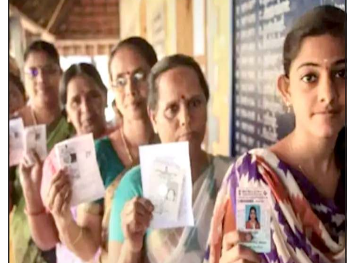
પુરાવાઓ માન્ય ગણ્યા છે. જેમાં (૧) ફોટા સાથેનો પાસપોર્ટ (૨) ફોટા સાથેનું ડ્રાઈવિંગ લાયસન્સ (ચુંટણીની તારીખથી ૧ માસ અગાઉ ઈસ્યુ થયેલ) (૩) ફોટા સાથેનું ઈન્કમેટેક્સ (પાન) ઓળખકાર્ડ (૪) રાજ્ય સરકાર, કેન્દ્ર સરકાર, જાહેર સાહસો અથવા પબ્લીક લીમીટેડ કંપનીઓ તરફથી તેઓના કર્મચારીઓને આપવામાં આવેલ ફોટા સાથેના ઓળખકાર્ડ (૫) પબ્લીક સેક્ટર બેંકો અને પોસ્ટ ઓફીસો

પ્રતિનિધિ, ગાંધીનગર કેન્દ્રીય ચુંટણીપંચ દ્વારા ગુજરાત રાજ્યમાં મતદારોને ફોટો ઓળખપત્ર પુરા પાડવામાં આવે છે. સ્થાનિક સ્વરાજ્યની ચુંટણીઓમાં મતદાર પોતાનો મતાધિકારનો ઉપયોગ કરી શકે તે માટે મતદાનને મળેલા ફોટો ઓળખપત્રો મતદાન મથકે રજૂ કરવાની સુચના છે. આ ઉપરાંત રાજ્ય ચુંટણી આયોગે મતદારના ઓળખપત્ર માટેના વૈકલ્પિક દસ્તાવેજ પુરાવાઓ પણ માન્ય કરેલા છે. ૨૨ જાન્યુઆરી ૨૦૧૬ નો આદેશ ૨૬ કરી ભારતના બંધારણના અનુચ્છેદ ૨૪૩ (૬) અને ૨૪૩(વ-ક) થી રાજ્ય ચુંટણી આયોગને મળેલ સત્તાની રૂએ હવે પછીની સ્થાનિક સ્વરાજ્યની યોજનાર ચુંટણીઓ માટે મતદાન ઓળખપત્ર માટે કેટલીક સુચનાઓનો અમલ કરવા આદેશ કરવામાં આવ્યા છે. જો કોઈ મતદાર આવુ ફોટો ઓળખપત્ર રજૂ ન કરી શકે તો સ્થાનિક સ્વરાજ્યની ચુંટણીઓમાં સંબંધિત મતદારની ઓળખ પ્રાસ્થાપિત થાય તે માટે રાજ્ય ચુંટણી આયોગે કેટલાક દસ્તાવેજ