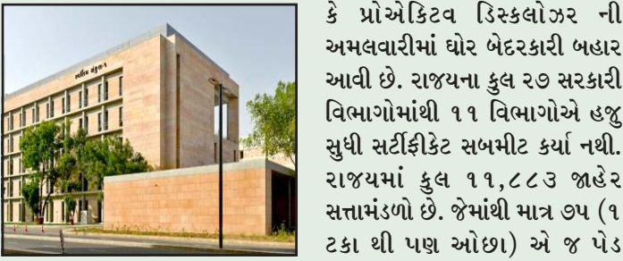
૨૭ માંથી ૧૧ વિભાગના પ્રજાના નોકરો જવાબ દેવામાં ઉણા ઉતર્યા છે. સુપ્રિમ કોર્ટના કડક આદેશો અને રાજ્યના સામાન્ય વહિવટ વિભાગ દ્વારા વારંવાર પરીપત્રો બહાર પાડવા છતાં ગુજરાતમાં માહિતી અધિકાર હેઠળની સેક્શન-૪ (૧) (બી) એટલે

પ્રતિનિધિ, ગાંધીનગર સરકાર એક તરફ ડીઝીટલ ઈન્ડિયા અને પારદર્શિતાની વાતો કરે છે. તો બીજી તરફ સરકારી વિભાગો પોતાની પાયાની વિગતો જાહેર કરવામાં પણ વામણ સાબિત થઈ રહ્યા છે. સરકાર એક તરફ ડીઝીટલ ઈન્ડિયા અને પારદર્શિતાની વાતો કરે છે. તો બીજી તરફ સરકારી વિભાગો પોતાની પાયાની વિગતો જાહેર કરવામાં પણ આનાકાની કરી રહ્યા છે. જે નાગરીકોના માહિતી મેળવવાના લોકશાહી અધિકાર પર તરખા સમાન છે. રાજ્ય સરકારના