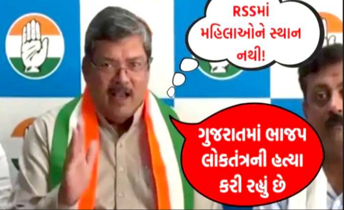
કોંગ્રેસના નેતા મુકુલ વાસનિકે આ મામલે મીડીયાને સંબોધતા જણાવ્યું હતું કે સંસદમાં જે બિલ રજૂ થયું તે મહિલા સંશોધન બિલ ન હતું, આ બિલ પરીસીમન એટલે કે વસ્તીગણતરીના આધારે દેશ કે રાજ્યમાં લોકસભા અને વિધાનસભાના ચૂંટણી મતવિસ્તારોની સીમાઓનું પુન: નિર્ધારણ કરવા માટેનું બિલ હતું. કોંગ્રેસના પ્રભારી મુકુલ વાસનિકે ખાસ ભાજપ અને વડાપ્રધાન નરેન્દ્ર મોદી પર નિશાન સાધતા જણાવ્યું હતું કે પ્રધાનમંત્રીએ માત્ર દેશની આંખમાં ધુળ નાખવાનું કામ કર્યું છે.

પ્રતિનિધિ, ગાંધીનગર કોંગ્રેસના પ્રભારી મુકુલ વાસનિકે હાલ ચૂંટણીના પડયમની વચ્ચે રાજકોટની મુલાકાતે આવ્યા હતા. ત્યારે તેમણે તાજેતરમાં ભારતીય સંસદમાં ૨૬ થયેલા મહિલા સંશોધન બિલ અંગે આપેલા નિવેદન પર હાલ ચર્ચાઓ શરૂ થઈ છે.