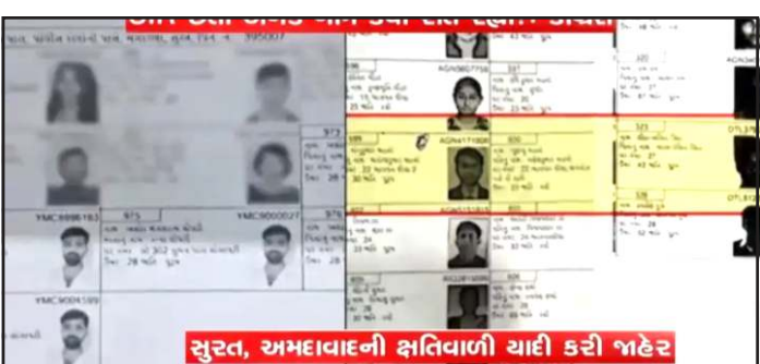
સુરત, અમદાવાદની ક્ષતિયાળી યાદી કરી જાહેર કર્યાં હતાં કે વટવા વિસ્તારમાં અનેક પેજ પર એક જ વ્યક્તિનું નામ, ફોટો અને સરનામું હોવા છતાં તે વારંવાર દાખલ કરવામાં આવ્યું છે. બુધ દિને જસદણ-વીંછીયા સૌથી નબળું પુરવાર થયું હતું. જયાં મહત્તમ બેઠકો કોંગ્રેસે આંચકી લીધી હતી. રાજકીય

પ્રતિનિધિ, ગાંધીનગર અમદાવાદના વટવા વિસ્તારમાં મતદાર યાદી અંગે ગંભીર ગરબડ કરાઈ હોવાના આક્ષેપો બહાર આવ્યા છે. અમદાવાદ શહેર કોંગ્રેસ દ્વારા જાહેર કરાયેલા દાવા મુજબ અનેક બુધની યાદીમાં એક જ મતદારનું નામ અનેકવાર નોંધાયેલું જોવા મળ્યું હતું. આ મુદ્દે રાજકીય ગરમાવો વધ્યો છે. જયારે એસઆઈઆરના નામે કેન્દ્રીય ચૂંટણીપંચે સમગ્ર ગુજરાતની મતદાર યાદી અદ્યતન કરી હોવાનો દાવો કર્યો હોય તો આ પ્રકારે રહી રહવા છે. જે નાગરીકોના માહિતી મેળવવાના લોકશાહી અધિકાર પર તરખા સમાન છે. રાજ્ય સરકારના