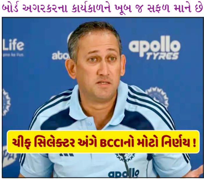
મેન્સ T20 વર્લ્ડ કપ, ૨૦૨૫ ICC ચેમ્પિયન્સ ટ્રોફી અને ૨૦૨૬ ICC મેન્સ T20 વર્લ્ડ કપ જેવા મોટા ખિતાબ જીત્યા છે. વધુમાં ટીમ ૨૦૨૩ ICC વર્લ્ડ કપની ફાઇનલમાં

(સંપૂર્ણ સમાચાર સેવા)નવી દિલ્લી ભારતીય ક્રિકેટ અંગે ટૂંક સમયમાં એક મોટો નિર્ણય જાહેર થવાની ધારણા છે. એવી પ્રબળ શક્યતા છે કે અજીત અગરકરને મુખ્ય પસંદગીકાર તરીકેનો કાર્યકાળ લંબાવવામાં આવશે. તેમનો વર્તમાન કરાર જૂન ૨૦૨૬માં સમાપ્ત થવાનો છે. જો કે, ભારતીય ક્રિકેટ કંટ્રોલ બોર્ડ (BCCI) નજીકના ભવિષ્ય માટે તેમને આ ભૂમિકામાં જાળવી રાખવાના પક્ષમાં છે. સૂત્રોના જણાવ્યા અનુસાર, બોર્ડે હવે ૨૦૨૭ના ICC ODI વર્લ્ડ કપ પર સીધી નજર રાખી છે. આ ઉદ્દેશ્યને ધ્યાનમાં રાખીને અગરકરને કાર્યકાળ લંબાવવાનો નિર્ણય લગભગ નિશ્ચિત માનવામાં આવે છે. બોર્ડ અગરકરના કાર્યકાળને મૂળ જ સફળ માને છે. તેમના નેતૃત્વ હેઠળ એક ઈન્ડિયાએ સતત મોટી ટુર્નામેન્ટમાં શાનદાર પ્રદર્શન કર્યું છે. ભારતે ૨૦૨૪ ICC