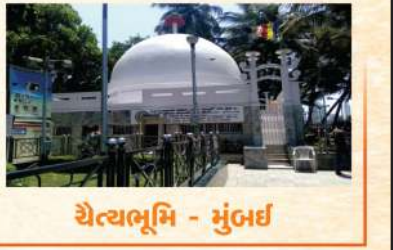
ચૈત્યભૂમિ - મુંબઈ