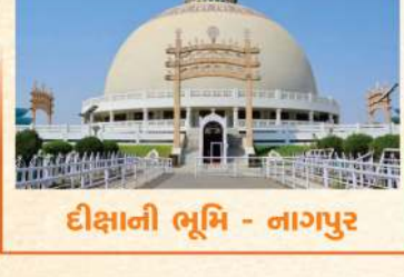
દીક્ષાની ભૂમિ - નાગપુર