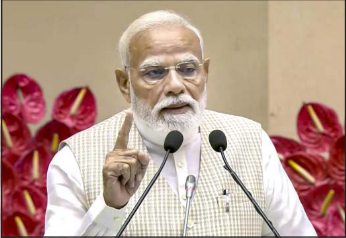
હેઠળ મહિલાઓએ ૬૦%થી વધુ લોકોની લીધી છે. મહિલાઓ પણ દેશની સ્ટાર્ટઅપ ક્રાંતિ (startup revolution)નું નેતૃત્વ કરી રહી છે જે મોખરે છે. આજે, ૪૨%થી વધુ રજિસ્ટર્ડ સ્ટાર્ટઅપ્સમાં ઓછામાં ઓછી એક મહિલા ડાયરેક્ટર છે. સ્કીલ ઈન્ડિયા મિશન અને વોકેશનલ ટ્રેનિંગના પરિણામે આજે હજારો ડ્રોન દીદી કૃષિ ક્રાંતિનું નેતૃત્વ કરી રહી છે.

હતો. ત્યારે એક સૂરે એ વાત પણ ઉઠી હતી કે કોઈપણ સંજોગોમાં ૨૦૨૮ સુધીમાં આ લાગુ થઈ જવો જોઈએ. આપણા વિપક્ષના તમામ સાથીઓએ પણ ભાર આપ્યો હતો કે ૨૦૨૮માં આ લાગુ થઈ જવો જોઈએ. પીએમ મોદીએ કહ્યું કે, આપણો પ્રયાસ અને પ્રાથમિકતા છે કે આ વખતે પણ આ કાર્ય સંવાદ, સહયોગ અને સહભાગિતાથી થાય. તેમણે ગૌરવ સાથે જણાવ્યું કે, હાલમાં દેશમાં રાષ્ટ્રપતિથી લઈને નાણામંત્રી જેવા મહત્વના પદો મહિલાઓ જ સંભાળી રહી છે. ભારતમાં ૧૪ લાખથી વધુ મહિલાઓ સ્થાનિક સ્વરાજની સંસ્થાઓમાં સફળતાપૂર્વક કાર્ય કરી રહી છે. લગભગ ૨૧ રાજ્યોમાં પંચાયતોમાં તેમની ભાગીદારી આશરે ૫૦% સુધી પહોંચી ગઈ છે. તેમણે કહ્યું કે જ્યારે નિર્ણય લેવાની પ્રક્રિયામાં મહિલાઓની સહભાગિતા વધે છે ત્યારે વ્યવસ્થામાં વધુ સંવેદનશીલતા આવે છે.