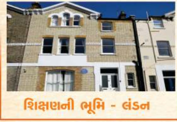
શિક્ષણની ભૂમિ - લંડન

બાબા સાહેબના સપનાઓને સાકાર કરવા માટે અનુસૂચિત જાતિ (SC) અને અનુસૂચિત જનજાતિ (ST) ના ઉત્થાન માટે ભારત સરકારના પ્રયાસો