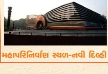
મહાપરિનિર્વાણ સ્થળ-નવી દિલ્હી