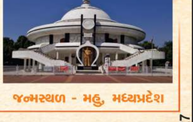
જન્મસ્થળ - મહુ, મધ્યપ્રદેશ

14 એપ્રિલ, 2026 સવારે 9:30 થી 12:30 કલાક સુધી પ્રેરણા સ્થળ, સંસદ ભવન સંકુલ પ્રવેશદ્વાર - તાલ કટોરા રોડ, TKR-II, ગુરુદ્વારા રજાબગંજ ખાતે