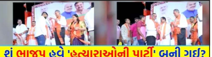
શુ ભાજપ હવે 'હત્યાઓની પાર્ટી' બની ગઈ?