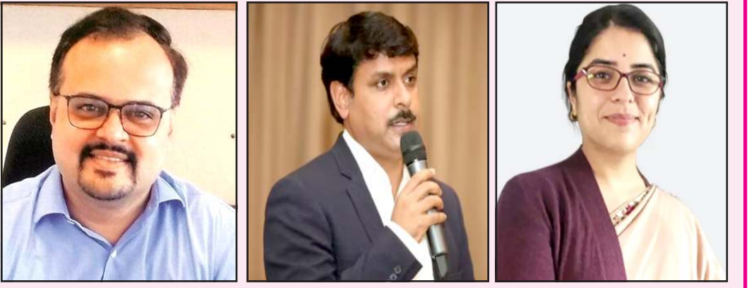
ચુંટણીખર્ચ ની યોગ્યતા અને પારદર્શિતા ચકાસવી પડશે તેમજ આ તમામનો ચુંટણી આયોગને મુદ્દાઓ વિશે વિગતવાર દરેક તબક્કાની પ્રગતિ અને અહેવાલ મોકલવો પડશે.

પ્રતિનિધિ,ગાંધીનગર રાજ્ય ચુંટણી આયોગ દ્વારા મહાનગર પાલિકાઓ, નગરપાલિકાઓ તેમજ જિલ્લા અને તાલુકા પંચાયતોની સામાન્ય અને પેટા ચુંટણીઓના સુચારૂ અને નિષ્પક્ષ આયોજન માટે મહત્વનો હુકમ બહાર પાડ્યો છે. આ નિર્ણયનો હેતુ ચુંટણીઓ મુક્ત, પારદર્શક અને ન્યાયી વાતાવરણમાં યોજાય તે છે. સર્વિધાનની કલમો અને મ્યુનિસિપલ અને પંચાયત નિયમોના આધારે આયોગ દ્વારા વિવિધ ઉચ્ચ અધિકારીઓને ચુંટણી નિરીક્ષક તરીકે નિમણૂકમાં આવ્યા છે. નિરીક્ષકોની મુખ્ય જવાબદારી મતદાન પ્રક્રિયાની દેખરેખ, કાયદો - વ્યવસ્થા જાળવવો, ઈવીએમ મશીનો તથા મતપત્રોની ગુણવત્તા તપાસવી અને ઉમેદવારોના ખર્ચ રજીસ્ટરનું નિરીક્ષણ કરવું. આ નિર્ણયનો હેતુ ચુંટણીઓ મુક્ત, પારદર્શક અને ન્યાયી વાતાવરણમાં યોજાય તે છે. ૩૪ નિરીક્ષકો અને સાંપાચેલ જિલ્લાઓની વિગતો તરફ નજર કરીએ તો. નિરીક્ષકોની મુખ્ય કામગીરી તરફ નજર કરીએ તો નિરીક્ષકોએ સૌ પ્રથમ દરેક મતદાન મથકો અને મતગણતરી કેન્દ્રોની મુલાકાત લેવી પડશે તેમજ ઈવીએમ મશીનો અને મતપત્રોની ગુણવત્તા ચકાસવી પડશે. તેમજ કાયદો અને વ્યવસ્થા જાળવવા માટે પોલીસ સ્થાનિક તંત્ર સાથે સંકલનમાં રહેવું પડશે. તેમજ ઉમેદવારોના ખર્ચના રજીસ્ટરનું નિરીક્ષણ કરવું પડશે. જેમાં