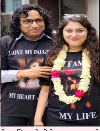
તેના પિતાએ તેને હાર માનવાને બદલે નવી શરૂઆત કરવા માટે પ્રોત્સાહિત કરી હતી. પ્રતીક્ષા ના પિતા, જેઓ નિવૃત્ત જજ છે. તેમણે આ પ્રસંગને ખાસ બનાવવા માટે

(છગનલાલ મેવાડા ધ્વારા) સુરત સમાજમાં સામાન્ય રૂપે દિકરીના છૂટાછેડા થાય ત્યારે માતા-પિતાની સાથે સમગ્ર પરિવાર પણ દુઃખી થતો હોય છે. એને બદલે ઉત્તર પ્રદેશના મેરઠમાં એક પિતાએ સામાજિક રૂઢિચુસ્તતા તોડીને એક નવો ચીલો ચાત્યો છે. પોતાની પુત્રીના છૂટાછેડા પર શોક મનાવવાને બદલે આ પરિવારે ઢોલ-નગારા અને પુષ્પવર્ષા સાથે તેનું ભવ્ય સ્વાગત કરીને આ પ્રસંગને ઉત્સવમાં ફેરવી નાખ્યો હતો. સોશિયલ મીડિયા પર આ