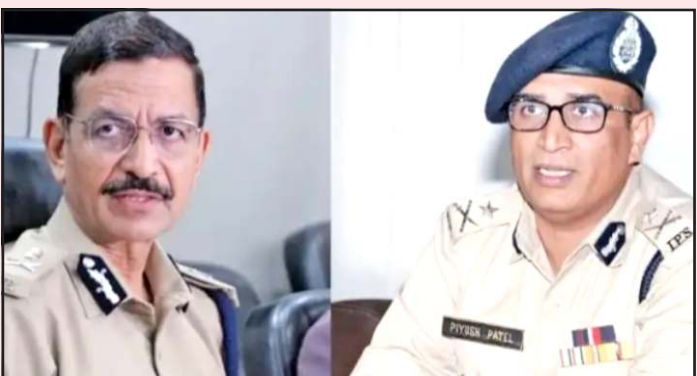
પોલીસ કમિશ્નર જી એસ મલીકને સર્વાનુમતે પ્રમુખ તરીકે અને પીયુષ પટેલને ઉપપ્રમુખ તરીકે ચુંટવામાં આવ્યા હતા. આ ઉપરાંત સેક્રેટરી તરીકે

પ્રતિનિધિ, ગાંધીનગર ગુજરાતના આઈપીએસ એસોસીએશનના ગુજરાત ચેપ્ટરની એક મહત્વની બેઠક યોજાઈ હતી. આ બેઠકમાં ગાંધીનગર અને અમદાવાદના ઉચ્ચ પોલીસ અધિકારીઓ પ્રત્યક્ષ હાજર રહ્યા હતા. જ્યારે રાજ્યના અન્ય જિલ્લાઓના અધિકારીઓએ વિડીયો કોન્ફરન્સ દ્વારા હાજરી આપી હતી. બેઠકમાં એસોસીએશનના નવા પદાધિકારીઓની વરણી અને પડતર પ્રશ્નો અંગે ચર્ચા કરવામાં આવી હતી. બેઠકમાં અમદાવાદના