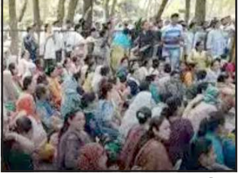
સરકાર દ્વારા સ્વીકારવામાં આવેલી અનેક મહત્વપૂર્ણ માંગણીઓ આજે પણ કાગળ પર જ છે. ખાસ કરીને ઉચ્ચતર પગારધોરણ, ટેકનીકલ કેડરના પ્રશ્નો અને વિવિધ જગ્યાઓના અપગ્રેડેશન જેવા

પ્રતિનિધિ, ગાંધીનગર રાજ્યમાં સ્થાનિક સ્વરાજ્યની ચુંટણીઓ નજીક આવી રહી છે. ત્યારે રાજ્યના આરોગ્ય કર્મચારીઓ ફરી એકવાર સક્રિય બન્યા છે. આરોગ્ય કર્મચારી સંઘ અને મહાસંઘ દ્વારા સરકારને અગાઉ કરવામાં આવેલા વાયદાઓની યાદ અપાવીને તાત્કાલીક અમલ માટે દબાણ વધારવામાં આવી રહ્યું છે. આ તરફ સંઘના આગેવાનોનું કહેવું છે કે અગાઉના આંદોલન દરમિયાન