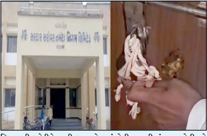
વિભાગની કચેરીને જપ્તી કરવાનો હુકમ કર્યો હતો. જેના ભાગરૂપે ચાણસ્મા કોર્ટના ૨ બેલીફ અને

પ્રતિનિધિ, ગાંધીનગર પાટણ જિલ્લાના ચાણસ્માની નર્મદા કચેરીના એકિઝક્યુટીવ એન્જિનિયરની ઓફીસને સીલ મારી દેવામાં આવતા સનસનાટી મચી જવા પામી છે. મોદેરાથી ધારીયાલ રોડ પર ૨૦૦૧ ની સાલ માં જમીન સંપાદન કરવામાં આવી હતી. જેનું ખેડુત અરજદાર ને તેનું વળતર ન ચુકવતા ખેડુતદ્વારા કડી કોર્ટ માં કેસ દાખલ કરવામાં આવ્યો હતો. જે મામલે કડી કોર્ટના જજ દ્વારા ચાણસ્મા નર્મદા