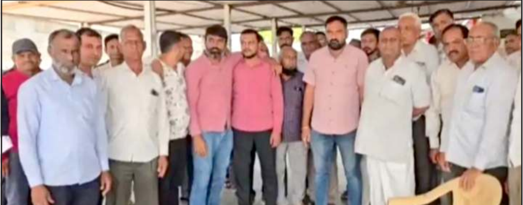
આવ્યો હતો. જે બાદ ૧૧ ગામના ખેડૂતોનું આંદોલન શાંત પડ્યું હતું. તે હવે ફરી જવાબા બનીને બહાર આવ્યું છે. ૧૧ ગામના ખેડૂતોનો આરોપ છે કે સરકાર સાથેની બેઠકમાં જે નિર્ણયો લેવાયા હતા તેની સ્થાનિક તંત્ર અમલવારી કરતુ નથી, હિંમતનગરના કાંકણોલમાં આંદોલન સમિતિની એક મહત્વની બેઠક યોજાઈ હતી. જેમાં

પ્રતિનિધિ, ગાંધીનગર ગુજરાતમાં સ્થાનિક સ્વરાજ્યની ચુંટણીઓનો માહોલ જામ્યો છે. તો કેટલાક ડેંકાણે ભાજપના નેતાઓ કોંગ્રેસમાં જોડાતા તો કેટલાક નેતાઓ આમ આદમી પાર્ટીમાં જોડાતા તો કેટલાક નેતાઓ ભાજપમાં પણ જોડાઈ રહ્યા છે. સાથે સાથે સાબરકાંઠા જિલ્લાની જિલ્લા પંચાયત, નગરપાલિકા અને તાલુકા પંચાયતોની ચુંટણીઓ યોજાવાની છે. ત્યારે જિલ્લાના મુખ્યમથક હિંમતનગરમાં હુડાના નિર્ણયને સરકાર દ્વારા ૪ મહિના અગાઉ સ્થગિત કરવામાં