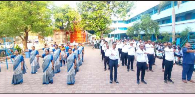
પોર્ન્ટ અને સિગનેચર કેમ્પિયન જેવા કાર્યક્રમો યોજાયા હતા. આ મુદ્દિત મુખ્ય આકર્ષણ NCC, NSS અને સ્કાઉટના વિદ્યાર્થીઓ છે, જેઓ પોતાના વિસ્તારના 'શતાયુ મતદારો' (૧૦૦

તાકાત' જેવા સૂત્રો સાથે વિદ્યાર્થીઓએ પોસ્ટર રેલી યોજાતા. ૨૬ એપ્રિલ, ૨૦૨૬ના રોજ થનાર મતદાનમાં સૌને સહભાગી થવા અપીલ કરી હતી. કાર્યક્રમના અંતે તમામ વિદ્યાર્થીઓ, શિક્ષકો અને વાલીઓએ શત-પ્રતિશત મતદાન કરવાના સામૂહિક શપથ લીધા હતા. આ પ્રસંગે શ્રેષ્ઠ દેખાવ કરનાર વિદ્યાર્થીઓને પ્રોત્સાહિત કરી, શિક્ષણ વિભાગે શાળાઓના માધ્યમથી ઘર-ઘરે લોકશાહીના આ મહાપર્વનો સંદેશ પહોંચાડી રાષ્ટ્રનિર્માણમાં પોતાનું અમૂલ્ય યોગદાન આપ્યું છે.