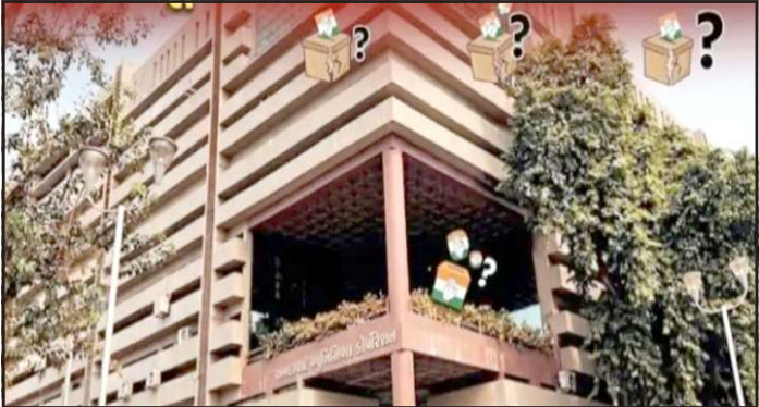
કોર્પોરેશનની વોટર લીસ્ટમાં અદ્રશ્ય થયા છે. ઉમેદવારી ફોર્મ ભરવા માટે ઉમેદવારનું નામ હોવું અથવા મતદારનો દાખલો જરૂરી છે. જો નામ ન હોય તો નોમીનેશન પેપર સ્વીકારવામાં આવી શકે નહીં અથવા

પ્રતિનિધિ, ગાંધીનગર અમદાવાદ મ્યુનિસિપલ કોર્પોરેશનની ચુંટણી માટે ગુજરાત કોંગ્રેસે ૫ અને ૬ એપ્રિલે પ્રથમ ઉમેદવારી યાદી જાહેર કરી હતી. આ યાદીમાં અમદાવાદના ૪૮ વોર્ડ માંથી ૩૨ વોર્ડ માટે કુલ ૯૨ થી ૯૩ ઉમેદવારોના નામ જાહેર કરવામાં આવ્યા હતા. જેમાં ૪૨ મહિલા ઉમેદવારો સામેલ છે. પાર્ટીએ આ યાદીને મજબૂત ગ્રાસરૂટ કાર્યકર્તાઓ અને અનુભવી ચહેરાઓને તક આપવાના રૂપમાં કરી છે. જેમાં દરીયાપુર, દાણીલીમડા, અમરાઈવાડા અને અંબેડકા જેવા વોર્ડ માંથી કેટલાક બેઠક ધરાવતા કોર્પોરેટરને ફરીથી ટીકીટ આપવામાં આવી છે. પરંતુ યાદી જાહેર થતાની સાથે જ મોટો વિવાદ અને અગવડતાનું વાતાવરણ સર્જાયું છે. ખાસ કરીને ચાંદલોડીયા, ઈન્દ્રપુરી અને નવરંગપુરા વોર્ડ ના અનેક ઉમેદવારોના નામ અમદાવાદ મ્યુનિસિપલ કોર્પોરેશનની વર્તમાન મતદાર યાદી માં નથી મળતા, આ તકનીકી ખામીને કારણે કોંગ્રેસની આંતરીક તૈયારી અને વ્યવસ્થાપન પર સવાલો ઉઠી રહ્યા છે. ચાંદલોડીયા વોર્ડમાં ૩, ઈન્દ્રપુરીમાં ૪ અને નવરંગપુરામાં ૩ ઉમેદવારોના નામ જાહેર કરાયા છે. પરંતુ આમાના કેટલાક ઉમેદવારોના નામ