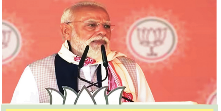
मोदी बोले- भाजपा मंत्र नागरिक देवो भव है

पीएम बोले- असम में गरीबों के लिए 22 लाख पक्के घर बनाएँ: पीएम ने कहा- होजाई शीतलमा माता की धरती है, और मां कामाख्या का पवित्र स्थल भी यहां से ज्यादा दूर नहीं है। मैं इन दिव्य शक्तियों को नमन करता हूँ और आज यहां मौजूद बड़ी संख्या में महिलाओं को एक बार