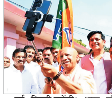
शाह ने कहा- भाजपा का मंत्र नेशनल फर्स्ट

योगी ने पार्टी के झंडे के साथ सेल्फी ली, म.प्र. में 17 नए कार्यालयों का भूमिपूजन