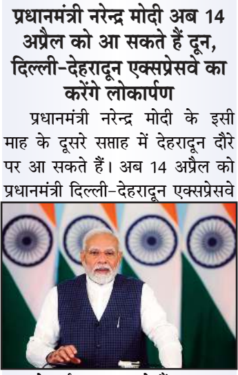
का लोकार्पण कर सकते हैं। प्रधानमंत्री मोदी का पहले चार अप्रैल को देहरादून आने का कार्यक्रम तय माना जा रहा था। इस दौर में प्रधानमंत्री दिल्ली-देहरादून एक्सप्रेसवे का लोकार्पण करेंगे। उत्तराखंड के लिए यह परियोजना गेमचेंजर मानी जाती है।

प्रधानमंत्री नरेंद्र मोदी अब 14 अप्रैल को आ सकते हैं दून, दिल्ली-देहरादून एक्सप्रेसवे का करेंगे लोकार्पण प्रधानमंत्री नरेंद्र मोदी के इसी माह के दूसरे सप्ताह में देहरादून दौरे पर आ सकते हैं। अब 14 अप्रैल को प्रधानमंत्री दिल्ली-देहरादून एक्सप्रेसवे का लोकार्पण कर सकते हैं। प्रधानमंत्री मोदी का पहले चार अप्रैल को देहरादून आने का कार्यक्रम तय माना जा रहा था। इस दौर में प्रधानमंत्री दिल्ली-देहरादून एक्सप्रेसवे का लोकार्पण करेंगे। उत्तराखंड के लिए यह परियोजना गेमचेंजर मानी जाती है।