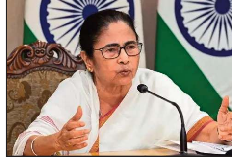
एक जनसभा को संबोधित करते हुए मुख्यमंत्री ममता बनर्जी ने कहा कि उन्हें इस गंभीर घटना की कोई

बुधवार, 1 अप्रैल को मालदा में तब स्थिति बेकाबू हो गई जब बड़ी संख्या में लोगों ने पाया कि उनके नाम सूची से हटा दिए गए हैं। वोटर लिस्ट में सुधार और आपत्तियों के निस्तारण का काम कर रहे 7 न्यायिक अधिकारियों को भीड़ ने घेर लिया और उन्हें बंधक बना लिया। यह बंधक संकट रात 1 बजे तक चला, जब पुलिस और अर्धसैनिक बलों को एक टुकड़ी ने हस्तक्षेप कर अधिकारियों को सुरक्षित निकाला। इस दौरान भीड़ ने जजों की गाड़ियों पर पथराव भी किया, जिसमें एक कार के शीशे चकनाचूर हो गए।