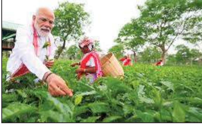
में प्रवेश कर चुका है। प्रधानमंत्री नरेंद्र मोदी ने कहा, 'पहले सरबानंद सोनोवाल के नेतृत्व में और फिर

पीएम मोदी ने कहा, 'आज मैं आपको एक खुशखबरी और देना चाहता हूँ। अभी तक आपने हाइवे पर फाइटर जेट उतरते देखे। अब यहां ब्रह्मपुत्र के पानी के नीचे से भी गाड़ियां गुजरेंगी। केंद्र सरकार ने ब्रह्मपुत्र के नीचे अंडर वॉटर टनल बनाने के निर्णय को स्वीकृति दे दी है। इस पर करीब साढ़े 18 हजार करोड़ रुपये खर्च किये जाएंगे।