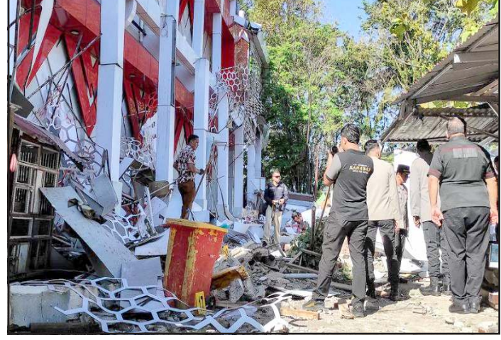
ઉત્તરી સુલાવેસી પ્રાંતના મનાડો શહેરમાં ભૂકંપના આંચકા એટલા તેજ હતા કે શહેરના લોકો જાગી ગયા હતા અને ગભરાઈને ઘરોની બહાર દોડી આવ્યા હતા

પેસિફિક સુનામી વોર્નિંગ સેન્ટરે જણાવ્યું છે કે ઈન્ડોનેશિયા, ફિલિપાઈન્સ અને મલેશિયાના દરિયાકાંઠાના વિસ્તારોમાં ભૂકંપના કેન્દ્રથી 1,000 કિમીના દાયરામાં જોખમી સુનામી લહેરો ઊઠી શકે છે. ઉત્તરી સુલાવેસી પ્રાંતના મનાડો શહેરમાં ભૂકંપના આંચકા એટલા તેજ હતા કે શહેરના લોકો જાગી ગયા હતા અને ગભરાઈને ઘરોની બહાર દોડી આવ્યા હતા. એક વ્યક્તિએ જણાવ્યું, “હું તરત જ જાગી ગયો અને ઘરની બહાર નીકળી ગયો. લોકો ગભરાઈને બહાર ભાગવા લાગ્યા હતા. નજીકમાં જ એક સ્કૂલ છે, ત્યાંના વિદ્યાર્થીઓ પણ જીવ બચાવવા માટે ઝડપથી બહાર મેદાન તરફ દોડ્યા હતા.”