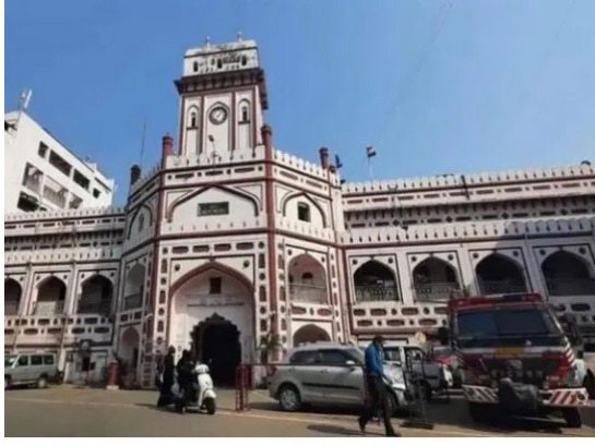
(छगनलाल मेवाड़ा द्वारा) सूरत।