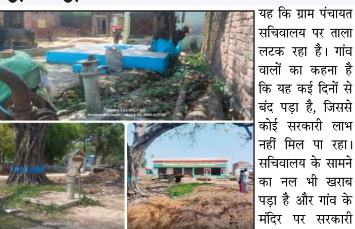
लगा हुआ है। सबसे शर्मनाक बात तो हुआ है। इन सबकी बदहाली घोटाले

(जीएनएस)। पीलीभीत/विकासखंड बीसलपुर की ग्राम पंचायत दुकसी में सरकारी सुविधाओं की दुर्दशा ने ग्रामीणों को परेशान कर दिया है। प्राथमरी स्कूल में पानी की व्यवस्था चरमरा गई है, विकलांगों के लिए शौचालय की रेलिंग टूटी पड़ी है। गांव में जगह-जगह इंडियन मार्का हैंडपंप खराब हो चुके हैं—एक नहीं, दर्जनों से अधिक। ग्राम प्रधान और सचिव की नजर अंदाजी या घोटालेबाजी की यह स्थिति उजागर हो रही है। सड़कों की हालत खस्ता है, सचिवालय के सामने गंदगी का अंबार