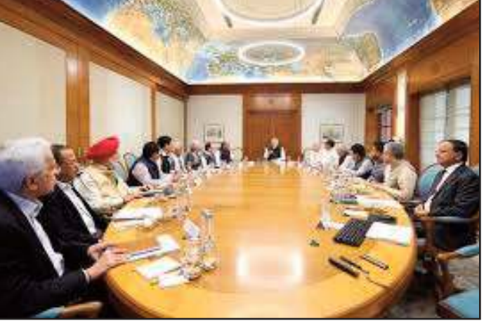
मंत्रालयों/विभागों द्वारा अब तक उठाए गए तथा नियोजित राहत उपायों पर विस्तृत प्रस्तुति दी। कृषि, उर्वरक, खाद्य सुरक्षा, पेट्रोलियम, बिजली, एम्पएसएआई, निर्यातक, शिपिंग, व्यापार, वित्त, आपूर्ति श्रृंखला और

पहले पूरी करने को कहा गया है। बैठक में सीएम योगी ने सख्त लहजे में निर्देश दिए कि व्यवस्थाओं में कोई कमी नहीं होनी चाहिए। निर्देश दिए गए हैं कि पाकिंग स्थलों पर मोबाइल शौचालय, हेल्प डेस्क, पीने का पानी और मेडिकल टीम हर वक्त तैनात रहे। एयरपोर्ट और रेली स्थल की ओर आने वाले सभी मार्गों पर विशेष सफाई अभियान चलाया जाए। कार्यक्रम के दौरान विजली आपूर्ति में एक सेकंड की भी कटौती न हो।