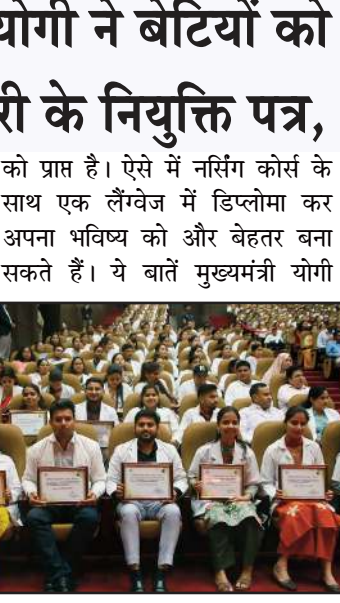
आदित्यनाथ ने रविवार को लोकभवन और जर्मनी यात्रा के दौरान भी नर्सिंग प्रोफेशनल्स की डिमांड की गई। वहां भारत के नर्सिंग प्रोफेशनल्स के बारे में लोगों के मन में आदर का भाव है। यह सौभाग्य हमारे नर्सिंग प्रोफेशनल्स

(जीएनएस)। मुख्यमंत्री योगी आदित्यनाथ ने 1,228 नर्सिंग अधिकारियों को नियुक्ति पत्र दिए। उन्होंने कहा कि प्रदेश में स्वास्थ्य ढांचा मजबूत हुआ है और मेडिकल-नर्सिंग सीटें बढ़ी हैं। वैश्विक अवसरों के लिए भाषा कोशल सीखने की भी सलाह दी। लखनऊ, 22 मार्च: आज नर्सिंग प्रोफेशनल्स की मांग केवल भारत ही नहीं, बल्कि दुनिया भर में है। जापान और जर्मनी यात्रा के दौरान भी नर्सिंग प्रोफेशनल्स की डिमांड की गई। वहां भारत के नर्सिंग प्रोफेशनल्स के बारे में लोगों के मन में आदर का भाव है। यह सौभाग्य हमारे नर्सिंग प्रोफेशनल्स