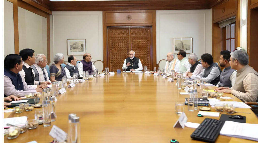
नेटवर्क को और अधिक सुदृढ़ करने पर जोर दिया। उन्होंने कहा कि ईंधन की समय पर डिलीवरी और उद्योगों को निर्बाध सप्लाई बनाए रखना

चुनौतीपूर्ण बन गई है। प्रधानमंत्री की इस अहम बैठक में Amit Shah, Rajnath Singh, Nirmala Sitharaman, S. Jaishankar, J. P. Nadda और Hardeep Singh Puri सहित कई वरिष्ठ मंत्री और उच्चाधिकारी मौजूद रहे। बैठक में सप्लाई चैन, लॉजिस्टिक्स, भंडारण क्षमता और वितरण तंत्र जैसे अहम पहलुओं पर विस्तार से चर्चा की गई। बैठक के दौरान प्रधानमंत्री मोदी ने स्पष्ट निर्देश दिए कि देश के किसी भी हिस्से में पेट्रोल, डीजल, एलपीजी गैस या बिजली की आपूर्ति बाधित नहीं होनी चाहिए। उन्होंने मंत्रालयों से कहा कि मौजूदा हालात को देखते हुए हर स्तर पर तैयारियां मजबूत रखी जाएं और किसी भी संभावित संकट की स्थिति में तत्काल प्रतिक्रिया देने की व्यवस्था सुनिश्चित की जाए। सूरजों के अनुसार, प्रधानमंत्री ने लॉजिस्टिक्स और डिस्ट्रीब्यूशन