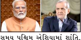
સમય પશ્ચિમ એશિયામાં શાંતિ, સ્થિરતા અને સમૃદ્ધિ લાવશે. વાતચીત દરમિયાન પ્રાદેશિક સુરક્ષાને લઈને ગંભીર ચર્ચાઓ કરવામાં આવી હતી. વડાપ્રધાન નરેન્દ્ર મોદીએ પશ્ચિમ એશિયામાં

મહત્વના ઈન્કસ્ટ્રક્ચર પર થઈ રહેલા હુમલાઓ પ્રત્યે ચિંતા વ્યક્ત કરી અને તેની સમત નિંદા કરી હતી. તેમણે જણાવ્યું કે, આવા હુમલાઓ માત્ર પ્રાદેશિક સ્થિતિ માટે જ નહીં, પરંતુ વૈશ્વિક સપ્લાય ચેઇન માટે પણ મોટો ખતરો સાબિત થઈ રહ્યા છે, જેના કારણે વિશ્વભરમાં માલસામાનની અવરજવર પર માઠી અસર પડી શકે છે. વૈશ્વિક વેપારના