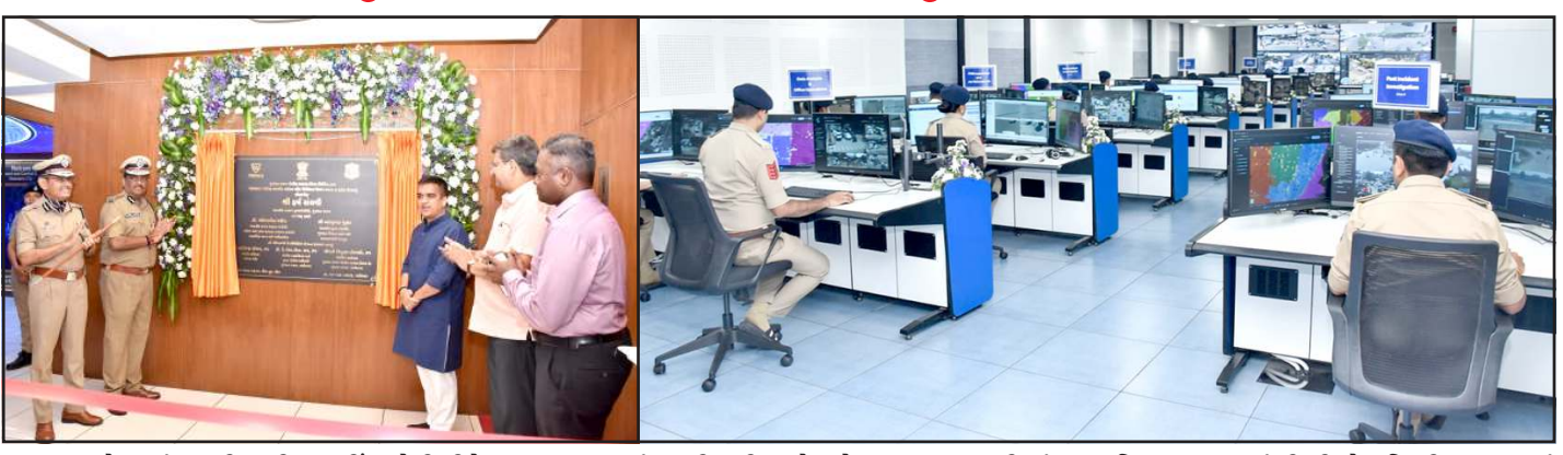
મુલાકાત લેવામાં આવી હતી. અહીં સીસીટીવી કેમેરા થકી વડોદરા શહેરમાં સુરક્ષા - ટ્રાફિકની દ્રષ્ટિએ કેવી રીતે નજર રાખવામાં આવી રહી છે? તે બાબતોની રસપ્રદ જાણકારી શ્રી સંઘવીએ અત્રેથી મેળવી હતી. તેમણે સુરક્ષા પ્રણાલીમાં આધુનિક ટેકનોલોજીનો મહત્તમ ઉપયોગ કરવા સૂચન કર્યું હતું. નાયબ મુખ્યમંત્રીશ્રીએ વિડીયો કૌભાંડ પોતાની નોંધ લખી શહેર પોલીસ કમિશનરશ્રીએ સુપ્રત કરી હતી.

વડોદરા શહેર પોલીસ કક્ષાના કમાન્ડ એન્ડ કન્ટ્રોલ સેન્ટરનું નાયબ મુખ્યમંત્રી શ્રી હર્ષભાઈ સંઘવીએ લોકાર્પણ કર્યું હતું. ગુજરાત પોલીસના સ્માર્ટ પોલીસિંગ અંતર્ગત નેત્રમ પ્રોજેક્ટ હેઠળ પોલીસ ભવનના સાતમા માળે સિટી લેવલનું આ આધુનિક સેન્ટર બનાવવામાં આવ્યું છે. વડોદરા શહેરની મુલાકાતે આવેલા નાયબ મુખ્યમંત્રી સીધા પોલીસ ભવન ખાતે પહોંચ્યા હતા અને અહીં તેમને ડીજીપી શ્રી કે. એલ. એન. રાવ અને શહેર પોલીસ કમિશનર શ્રી નરસિંહા કોમાર દ્વારા આવકારવામાં આવ્યા હતા. શહેર પોલીસની એક ટુકડી દ્વારા નાયબ મુખ્યમંત્રીશ્રીને ગાર્ડ ઓફ ઓનર આપવામાં આવ્યું હતું. બાદમાં આ મહાનુભાવો દ્વારા તકિતનું અનાવરણ કરવામાં આવ્યું હતું. પોલીસ કમિશનરશ્રીએ વડોદરા શહેર પોલીસ દ્વારા આધુનિક ટેકનોલોજીના વિનિમયથી કાર્યમ ડિટેક્શન, મહત્વના તહેવારોમાં બંદોબસ્ત, સંસાધનો અંગેની માહિતી પ્રસ્તુત કરી હતી. તત્પશ્ચાત મહાનુભાવો દ્વારા કમાન્ડ એન્ડ કન્ટ્રોલ સેન્ટરની