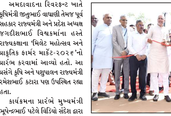
કરવામાં આવ્યો છે. રાજ્યભરમાં યોજાઈ રહેલાં મિલેટ મહોત્સવ વિશે વાત કરતાં તેમણે કહ્યું કે મુખ્યમંત્રી ભૂપેન્દ્રભાઈ પટેલના માર્ગદર્શન હેઠળ રાજ્યમાં પણ આ અભિયાનને વેગ આપવા માટે રાજ્ય સરકાર સતત કાર્યરત છે. જેના ભાગરૂપે રાજ્યનાં ૧૭ મહાનગરોમાં આ મહોત્સવ યોજાઈ રહ્યો છે. તેમણે જણાવ્યું કે વડાપ્રધાન શ્રી નરેન્દ્ર મોદીના પ્રયાસોથી વર્ષ ૨૦૨૩ને 'આંતરરાષ્ટ્રીય મિલેટ વર્ષ' તરીકે ઉજવવામાં આવ્યું હતું. આ મહોત્સવ દ્વારા બાજરી, જુવાર, રાગી, નાગલી, કાન અને મોરેયા જેવા પોષક

હિતમાં વડાપ્રધાન મોદીએ ફ્રીડમ ઓફ નેવિગેશન એટલે કે દરિયાઈ માર્ગો પર મુક્ત અવરજવરની જરૂરિયાત પર વિશેષ ભાર મૂક્યો હતો. તેમણે જણાવ્યું હતું કે, આંતરરાષ્ટ્રીય વેપારમાં કોઈ પણ પ્રકારનો અવરોધ ન આવે તે માટે શિપિંગ લેન્સ એટલે કે દરિયાઈ વેપારના માર્ગો સુરક્ષિત અને ખુલ્લા રહે તે અત્યંત મહત્વનું છે.