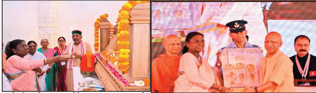
उत्सवों में पहले, प्राप्त कर लेंगे। समाज और विकसित राष्ट्र की परिकल्पना राम 21वीं सदी में, हमारे समावेशी विकसित राष्ट्र की परिकल्पना राम

गोस्वामी तुलसीदास कहते हैं कि राम-राज्य में न कोई दुखी है, न निर्धन है, न पगालंबी है, न बुद्धिहीन है और न ही कोई संस्कारहीन है।