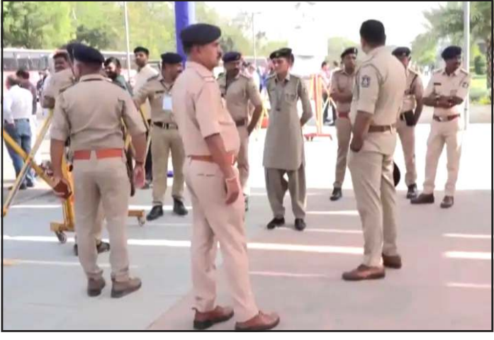
કેટલીક સ્કુલોને પણ બોમ્બ થી ઉડાવી દેવાની ધમકી મળતા પળભળાટ મચી જવા પામ્યો હતો. મેઈલના

પ્રતિનિધિ, ગાંધીનગર ગુજરાતમાં બોમ્બ થી ઉડાવી દેવાની ધમકીભર્યા મેઈલ મળવાનો સીલસીલો આજે પણ યથાવત છે. આ દરમિયાન આજે બુધવારે ગુજરાત વિધાનસભાને બોમ્બ થી ઉડાવી દેવાની ધમકી ભર્યા મેઈલ મળતા પોલીસ ઘટનાસ્થળે દોડી આવી હતી. બનાવની જાણ થતા બોમ્બ અને ડોગ સ્કવોડ ઘટનાસ્થળે પહોંચીને સર્ચ ઓપરેશન હાથ ધર્યું હતું. અંતે જ નહીં ગુજરાત વિધાનસભા બાદ બોર્ડ ની પરીક્ષાના છેલ્લા દિવસે અમદાવાદ શહેરની