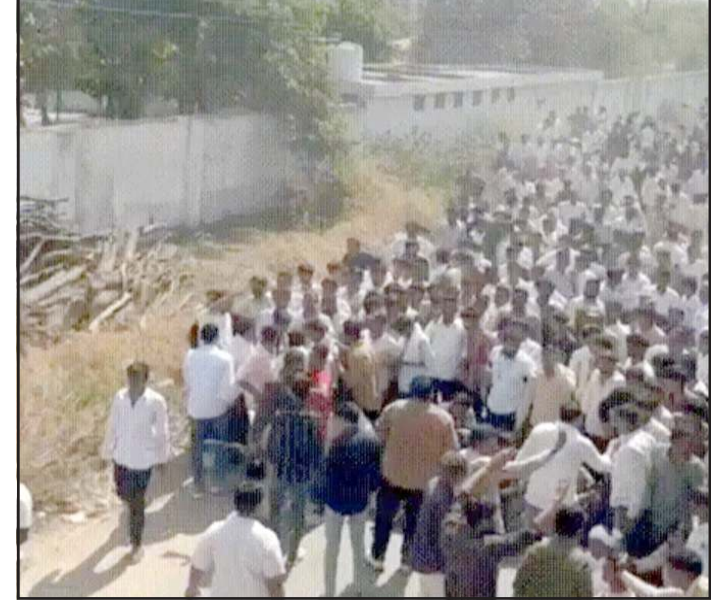
જેમાં ઉત્તર ગુજરાત સહિત સમાજના આગેવાનો અને મોટી રાજસ્થાનમાંથી પણ આંજણ ચૌધરી સંખ્યામાં લોકો ઉપસ્થિત રહ્યા હતા.

પ્રતિનિધિ, ગાંધીનગર બનાસકાંઠા જિલ્લાના ભાભર તાલુકાના રૂણી ગામે યોજાયેલા ચૌધરી સમાજના મહાસંમેલન બાદ વાતાવરણ તંગ બન્યું હતું. સમાજની ટિકરિને પરત લાવવાના મુદ્દે હજારોની સંખ્યામાં ચૌધરી સમાજના લોકો ઉમટી પડ્યા હતા. સંમેલન બાદ ટોળુ ઓગડના ઉણ ગામમાં પહોંચતા જ બબાલ મચી હતી અને ગાડીઓમાં તોડફોડ કરાઈ હતી. સાથે સાથે હાઈવે બ્લોક કરવાની ઘટના પર બનવા પામી હતી. રાધનપુરના સીના ગામની સીંગર કિંગલ રબારી ના પ્રેમલગ્નના વિવાદ બાદ ભાભર ના રૂણી ગામે ચૌધરી સમાજનું મહાસંમેલન યોજાયું હતું.