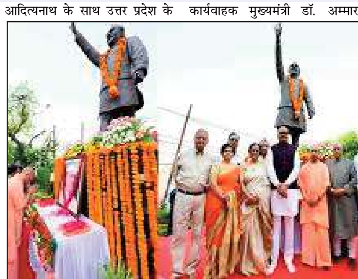
उपमुख्यमंत्री ब्रजेश पाठक, जल शक्ति मंत्री स्वतंत्र देव सिंह, पूर्व सांसद और पूर्व मंत्री रीत बहुगुणा (हेमवती नंदन बहुगुणा की पुत्री) और पूर्व

नंदन बहुगुणा भौतिक रूप से हमारे बीच नहीं हैं, लेकिन उनके द्वारा प्रारंभ किया गया कार्य, उनके द्वारा जनप्रतिनिधि, मुख्यमंत्री, केंद्रीय मंत्री के रूप में जो कुछ भी किया गया, वह समाज के प्रत्येक तबके, देश की समृद्धि और आम जन के कल्याण के लिए उदाहरण है। मुख्यमंत्री ने कहा, हेमवती नंदन बहुगुणा का जन्म तत्कालीन उत्तर प्रदेश और वर्तमान में उत्तराखंड के पौड़ी जिले के एक छोटे-से गांव में हुआ था। प्रारंभिक शिक्षा गांव में अर्जित कर उन्होंने आगे की शिक्षा के लिए प्रयागराज की भूमि को चुना। वह आजादी की लड़ाई में छात्र नेता के रूप में शामिल हुए और सामाजिक जनजागरूकता और राष्ट्रीय चेतना को आगे बढ़ाने के लिए उन्होंने लगातार प्रयास किए। इस मौके पर योगी