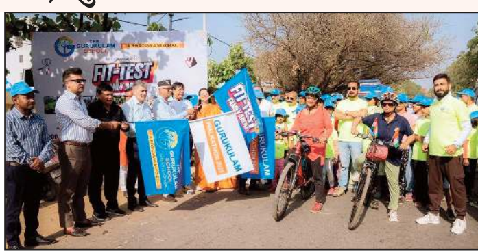
फिटनेस प्रेमियों की उत्साहपूर्ण भागीदारी देखने को मिली।

लखनऊ अलीगंज स्थित रॉयल स्पोर्ट्स मंच (आरएसजी) स्टेडियम में रविवार को आयोजित 'फिट-टेस्ट फैमिली एरीना वॉकार्थॉन एवं फिटनेस कार्यक्रम' में खिलाड़ियों, छात्रों और