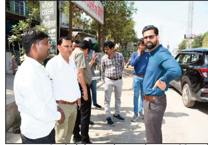
नगर स्वास्थ्य अधिकारी को रोड़ पर बेहतर सफाई व्यवस्था सुनिश्चित करने