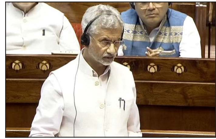
અમારી પ્રાથમિકતા છે. આંતરરાષ્ટ્રીય સ્તરે ઊર્જાના ભાવમાં થતા ફેરફાર પર અમે ચાંપતી નજર રાખી રહ્યા છીએ. વડાપ્રધાન મોદીએ 'ઇઈ', કતાર, કુવૈત, સાઉદી અરબિયા, જોર્ડન, ઓમાન અને ઈઝરાયલના વડાપ્રધાનો સાથે વાતચીત કરી છે. હું પણ સતત આ દેશોના વિદેશ મંત્રીઓના સંપર્કમાં છું. અમે અમારા રાજદ્વારી માર્ગો દ્વારા પણ ચર્ચા કરી રહ્યા છીએ. આ ઉપરાંત ઈરાનના વિદેશ મંત્રી અરાગચી સાથે પણ વાત કરવામાં આવી છે. અમે સતત સ્થિતિનું નિરીક્ષણ કરી રહ્યા છીએ. તેહરાન, UAE, દુબઈ અને બહેરીનમાં સ્થિત અમારા રાજદ્વારીઓ ભારતીય લોકોને સુરક્ષિત બહાર કાઢવા માટે તમામ

વિદેશ મંત્રી જયશંકરે આ યુદ્ધમાં માર્યા ગયેલા લોકો પ્રત્યે સંવેદના વ્યક્ત કરતાં કહ્યું કે, અમે ભારતીયોની સુરક્ષા સુનિશ્ચિત કરવા માટે પ્રતિબદ્ધ છીએ અને અમે સતત તેમના સંપર્કમાં છીએ.