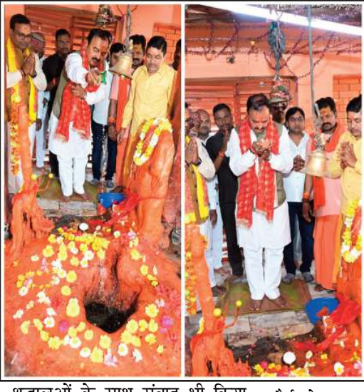
श्रद्धालुओं के साथ संवाद भी किया मौर्य ने जनपद कौशाम्बी में स्थित

(जीएनएस) उत्तर प्रदेश के उप मुख्यमंत्री श्री केशव प्रसाद मौर्य ने रविवार को जनपद कौशाम्बी स्थित प्राचीन एवं आस्था के प्रमुख केंद्र कड़ा वारिसी माता शीतला मंदिर में पहुंचकर विधिविधान से दर्शन एवं पूजन-अर्चना किया। इस अवसर पर उन्होंने माँ शीतला से समस्त प्रदेशवासियों के सुख, शांति, उत्तम स्वास्थ्य एवं समृद्धि की कामना की। उप मुख्यमंत्री ने मंदिर परिसर में