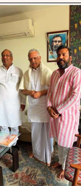
(जीएनएस) मझवार एवं तुरैहा (सभी उपजातियों) को अनुसूचितजाति में परिभाषित किये जाने के विषयों पर भी चर्चा हुई। इस दौरान ई० प्रवीण निषाद, मा० पूर्व सांसद एवं राष्ट्रीय संयोजक, निषाद पार्टी (एनडीए गठबंधन) भी मौजूद रहे।

इस अवसर पर उत्तर प्रदेश में एनडीए गठबंधन के अंतर्गत निषाद पार्टी द्वारा किए जा रहे संगठनात्मक एवं जनहित कार्यों से अवगत कराया गया। साथ ही निषाद पार्टी के कार्यकर्ताओं के समायोजन तथा मझवार एवं तुरैहा (सभी उपजातियों) को अनुसूचितजाति में परिभाषित किये जाने के विषयों पर भी चर्चा हुई। इस दौरान ई० प्रवीण निषाद, मा० पूर्व सांसद एवं राष्ट्रीय संयोजक, निषाद पार्टी (एनडीए गठबंधन) भी मौजूद रहे।