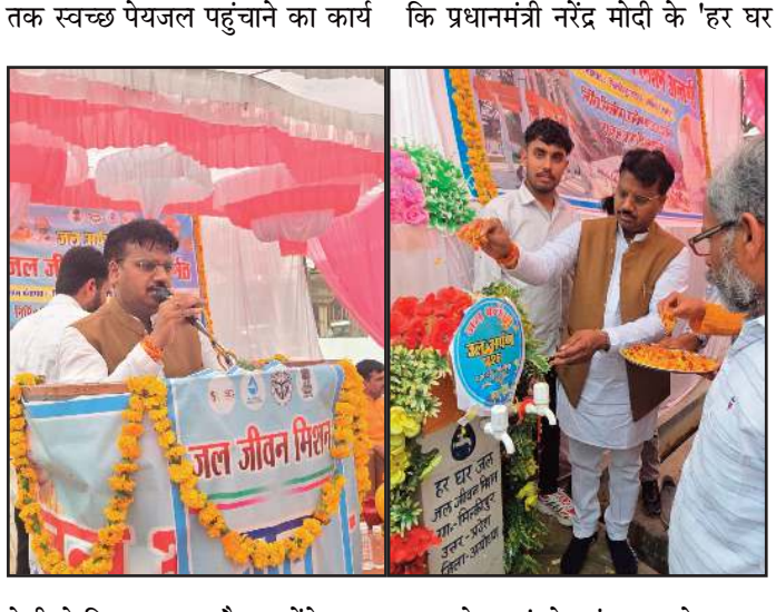
तेजी से किया जा रहा है। उन्होंने कहा नल से जल' के संकल्प को साकार

मिल्कीपुर 'जल ही जीवन है' के संदेश के साथ मिल्कीपुर विधानसभा क्षेत्र की ग्राम पंचायत मिल्कीपुर में जल जीवन मिशन के अंतर्गत ग्रामीण पेयजल जल अर्पण 2026 कार्यक्रम का आयोजन किया गया। कार्यक्रम में मिल्कीपुर के विधायक चंद्रभानु पासवान मुख्य अतिथि के रूप में शामिल हुए। इस दौरान विधायक ने ग्रामीणों को शुद्ध पेयजल उपलब्ध कराने की सरकार की प्रतिबद्धता पर जोर देते हुए कहा कि केंद्र और प्रदेश सरकार की योजनाओं के माध्यम से गांव-गांव तक स्वच्छ पेयजल पहुंचाने का कार्य