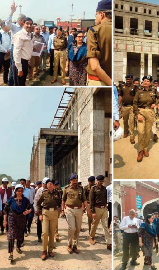
अवलोकन किया गया। निरीक्षण के