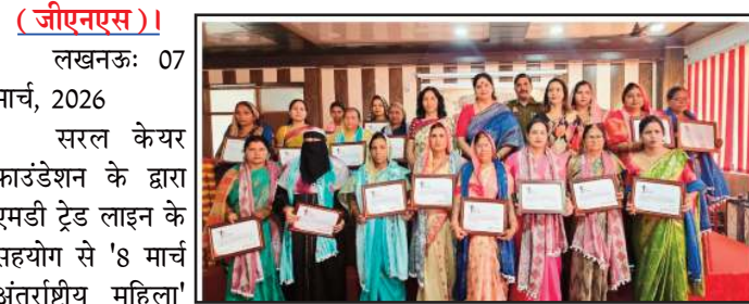
दिवस की पूर्व संस्था पर शारीश्री महिला ग्राम प्रधान सम्मान 2026