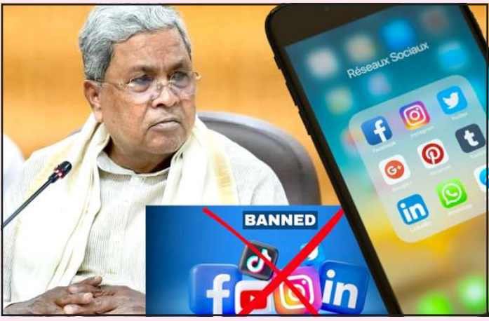
બાળકોના શિક્ષણ, શારીરિક ફિટનેસ અને માનસિક સ્વાસ્થ્ય પર પડી રહેલી નકારાત્મક અસરો પડી રહી છે. ગયા મહિને બેંગલુરુમાં આયોજિત કુલપતિ સંમેલનમાં મુખ્યમંત્રીએ આ મુદ્દે ગંભીર ચર્ચા કરી હતી અને શિક્ષણવિદોના મંતવ્યો પણ મંગાવવામાં આવ્યા હતા. સોશિયલ મીડિયા પર પ્રતિબંધની સાથે સરકારે ટેકનોલોજી ક્ષેત્રે પણ મોટી જાહેરાતો કરી છે. બેંગલુરુ રોબોટિક્સ અને AI ઈનોવેશન ઝોન: IISc હેઠળના AI અને ટેક પાર્ક દ્વારા ISRO અને Keonics ના સહયોગથી એક અત્યાધુનિક રોબોટિક્સ અને AI કેમ્પસ સ્થાપવામાં આવશે. વિકાસ અને કલ્યાણનો સમન્વય: સરકારે ઈન્ફ્રાસ્ટ્રક્ચર અને લાંબા ગાળાના આર્થિક પરિવર્તન સાથે જનકલ્યાણના કાર્યક્રમોને સંતુલિત કરવાની વ્યૂહરચના અપનાવી છે. પોતાનું ૧૭મું બજેટ રજૂ કરતા સિદ્ધાર્થમાયાએ કેન્દ્ર સરકારની ટીકા કરી હતી. તેમણે આરોપ લગાવ્યો હતો કે, કેન્દ્ર સરકાર ફેડરલ સિસ્ટમનું પાલન ન કરીને કર્ણાટક સાથે અન્યાય કરી રહી છે. તેમણે માંગ કરી હતી કે કેન્દ્ર સરકારે રાજ્યની માંગણીઓ પ્રત્યે વધુ સંવેદનશીલ બનવું જોઈએ. ઓસ્ટ્રેલિયા અને અન્ય ઘણા દેશો બાદ હવે ભારતનું કર્ણાટક રાજ્ય પણ બાળકોને ડિજિટલ દુનિયાના જોખમોથી બચાવવા માટે કડક કાયદા તરફ આગળ વધી રહ્યું છે.