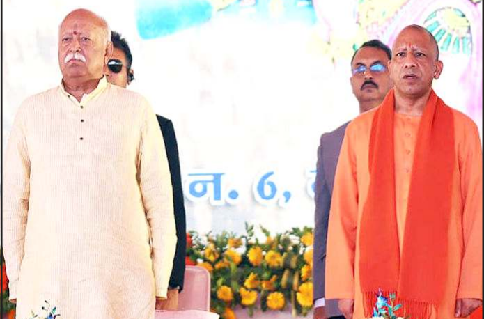
થઈ તે અંગે અનેક તર્કવિતર્ક સર્જાયા છે. જાણકારી અનુસાર, આ બેઠકનો મુખ્ય હેતુ સરકાર અને સંઘ વચ્ચે સમન્વય સાધવાનો હતો. આગામી વિધાનસભા ચૂંટણીને ધ્યાનમાં રાખીને સંઘના પદાધિકારીઓ સાથે રણનીતિ ઘડવામાં આવી હતી. સીએમ યોગીએ સરકારના કામકાજ અંગે સંઘ પાસેથી ગ્રાઉન્ડ લેવલનું ફીડબેક મેળવ્યું હતું. સંઘના સભ્યોએ સરકારી હોસ્પિટલો અને શાળાઓમાં માળખાગત સુવિધાઓ સુધારવા તેમજ માનવ સંસાધન વધારવા પર ભાર મૂક્યો હતો. બેઠકમાં માત્ર વિકાસની જ નહીં, પણ વહીવટી ખામીઓની પણ ચર્ચા થઈ હોવાનું જાણવા મળે છે. પોલીસ સ્ટેશનોમાં વ્યાપેલા ભટ્ટાચારનો મુદ્દો સંઘના પદાધિકારીઓએ ઉઠાવ્યો હતો. વર્તમાન કામોની સાથે ભવિષ્યના રોડમેપ પર પણ સંઘે સરકારને અનેક સૂચનો આપ્યા હતા. આ મહત્વની બેઠકમાં સંઘના અંદાજે ૪૦ જેટલા પદાધિકારીઓ હાજર રહ્યા હતા. મુખ્યમંત્રીની સાથે યુપી ભાજપ પ્રદેશ પ્રમુખ પંકજ યોધરી, સંગઠન મંત્રી ધર્મપાલ સિંહ, ક્ષેત્ર સંઘચાલક સૂર્યપ્રકાશ ટૉંક અને અન્ય ડિગ્ગજ નેતાઓ પણ ઉપસ્થિત હતા. બેઠક બાદ મુખ્યમંત્રીએ સંઘના હોદેદારો સાથે ભોજન પણ લીધું હતું.

(સંપૂર્ણ સમાચાર સેવા) લખનૌ બિહારમાં ૧૦ વખત મુખ્યમંત્રી રહી ચૂકેલા નીતીશ કુમારના રાજ્યસભામાં જવાના નિર્ણયે આખા દેશના રાજકારણમાં ખળભળાટ મચી ચુક્યો છે. દરમિયાન ઉત્તર પ્રદેશમાં પણ બેઠકોનો ધમધમાટ શરૂ થયો છે. મુખ્યમંત્રી યોગી આદિત્યનાથે ગાઝિયાબાદમાં રાષ્ટ્રીય સ્વયંસેવક સંઘ (RSS) ના ટોચના પદાધિકારીઓ સાથે અઢી કલાક સુધી લાંબી ચર્ચા કરી છે. ચુરવારે મુખ્યમંત્રી યોગી આદિત્યનાથનું પ્લેન હિંડન એરબેઝ પર લેન્ડ થયું હતું, ત્યારબાદ તેમનો કાફલો સીધો નેહરુ નગર સ્થિત સરસ્વતી વિદ્યા મંદિર પહોંચ્યો હતો. અહીં તેમણે મેરઠ પ્રાંતના સંઘના પદાધિકારીઓ સાથે બેઠક કરી હતી. આ બેઠકમાં શું ચર્ચા થઈ તે અંગે અનેક તર્કવિતર્ક સર્જાયા છે. જાણકારી અનુસાર, આ બેઠકનો મુખ્ય હેતુ સરકાર અને સંઘ વચ્ચે સમન્વય સાધવાનો હતો. આગામી વિધાનસભા ચૂંટણીને ધ્યાનમાં રાખીને સંઘના પદાધિકારીઓ સાથે રણનીતિ ઘડવામાં આવી હતી. સીએમ યોગીએ સરકારના કામકાજ અંગે સંઘ પાસેથી ગ્રાઉન્ડ લેવલનું ફીડબેક મેળવ્યું હતું. સંઘના સભ્યોએ સરકારી હોસ્પિટલો અને શાળાઓમાં માળખાગત સુવિધાઓ સુધારવા તેમજ માનવ સંસાધન વધારવા પર ભાર મૂક્યો હતો. બેઠકમાં માત્ર વિકાસની જ નહીં, પણ વહીવટી ખામીઓની પણ ચર્ચા થઈ હોવાનું જાણવા મળે છે. પોલીસ સ્ટેશનોમાં વ્યાપેલા ભટ્ટાચારનો મુદ્દો સંઘના પદાધિકારીઓએ ઉઠાવ્યો હતો. વર્તમાન કામોની સાથે ભવિષ્યના રોડમેપ પર પણ સંઘે સરકારને અનેક સૂચનો આપ્યા હતા. આ મહત્વની બેઠકમાં સંઘના અંદાજે ૪૦ જેટલા પદાધિકારીઓ હાજર રહ્યા હતા. મુખ્યમંત્રીની સાથે યુપી ભાજપ પ્રદેશ પ્રમુખ પંકજ યોધરી, સંગઠન મંત્રી ધર્મપાલ સિંહ, ક્ષેત્ર સંઘચાલક સૂર્યપ્રકાશ ટૉંક અને અન્ય ડિગ્ગજ નેતાઓ પણ ઉપસ્થિત હતા. બેઠક બાદ મુખ્યમંત્રીએ સંઘના હોદેદારો સાથે ભોજન પણ લીધું હતું.