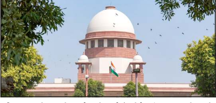
જસ્ટિસ પારડીવાલાની આગેવાની હેઠળની ખંડપીઠે નોંધ્યું હતું કે 16 ડિસેમ્બર, 2025એ અગાઉ આદેશ આપવા છતાં પતિ મધ્યસ્થી કાર્યવાહી માટે તેની પત્ની અને સગીર પુત્રીના મુસાફરી ખર્ચ માટે રૂ. 25,000 જમા કરાવવામાં નિષ્ફળ ગયો હતો. ચુકાદામાં જણાવવાનું હતું કે અત્યાર સુધી પતિએ તેની પત્નીને કે તેની સગીર પુત્રીને એક પણ પૈસા ચૂકવવાની તસ્દી લીધી નથી. કમનસીબે તેને છેલ્લા ચાર વર્ષથી તેની સગીર પુત્રીની પણ કોઈ રીતે સંભાળ રાખી નથી. સુનાવણી દરમિયાન ખંડપીઠે પતિએ દાખલ કરેલા સોગંદનામાની ચકાસણી કરી હતી. તેમાં જણાવવામાં આવ્યું હતું કે તેનો માસિક પગાર રૂ. 50,000 છે અને વાર્ષિક આવક રૂ. 6 લાખ છે. તેની પાસે કોઈ મોટી સંપત્તિ નથી અને તે લોન ચુકવણી સહિત નાણાકીય જવાબદારીઓનો સામનો કરી રહ્યો છે. સુપ્રીમ કોર્ટે સવાલ કર્યો હતો કે તેઓ વચગાળાના ભરણપોષણ માટેના બાકીના રૂ. 1.38 લાખ સહિત રૂ. 2.5 લાખ જમા કરવા તૈયાર છે કે નહીં. તેનો પતિએ ઈનકાર કર્યો હતો. આ પછી ખંડપીઠે આદેશ આપ્યો હતો કે આવા સંજોગોમાં અમારી પાસે પ્રતિવાદી પતિના એમ્પ્લોયરને તેના પગારમાંથી દર મહિને રૂ. 25,000 કાપવાનો આદેશ આપ્યા સિવાય બીજો કોઈ વિકલ્પ નથી. રિશદ શિપિંગ એન્ડ ક્લિયરિંગ એજન્સી પ્રાઇવેટ લિમિટેડને RTGS દ્વારા કાપેલી આ રકમ પતીના બેંક ખાતામાં ટ્રાન્સફર કરવાનો પણ આદેશ આપ્યો હતો. સુપ્રીમ કોર્ટે કહ્યું હતું કે દંપતીની સગીર પુત્રીના કલ્યાણને ધ્યાનમાં રાખીને આ આદેશ જરૂરી હતો, કારણ કે પુત્રીની સંભાળ ફક્ત તેની માતા દ્વારા જ લેવામાં આવે છે. આ કેસમાં પતિ-પત્ની 2022થી અલગ રહેતા હતાં. પત્નીએ સંપૂર્ણ અને અંતિમ સમાધાન તરીકે રૂ. 40 લાખ માંગ્યા હતાં.