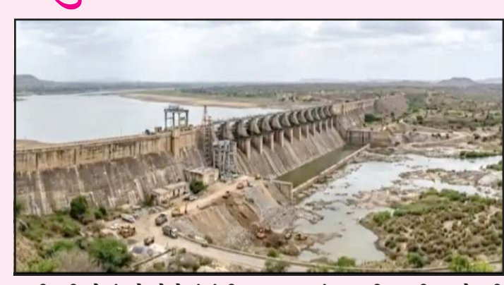
આવી હતી. જેમાં દસેક ડેમોમાં ગંભીર ખામી જોવા મળી, જેમ કે મોરબીના મચ્છુર ની સલામતી સુનિશ્ચિત કરવા ડેમના દરવાજા બદલવા માટે ભલામણ કરવામાં આવી હતી. મોરબી જિલ્લાના ડેમો ઉમાં ખામી જોવા મળી હતી. આ ડેમમાં થાંભલાનું નિરીક્ષણ કરતા ચિંતાજનક સ્થિતિ દેખાઈ હતી.

પ્રતિનિધિ, ગાંધીનગર ડેમોની સલામતીનો મુદ્દો લોકસભામાં ઉઠ્યો હતો. ત્યારે કેન્દ્રની સુચનાને પગલે ગુજરાતમાં ડેમોની સલામતીને લઈને ચકાસણી કરવામાં આવી હતી. જેમાં દસેક ડેમોમાં ગંભીર ખામી જોવા મળી હતી. જેના પગલે સરકારની ચિંતામાં વધારો થયો છે. વિધાનસભા ગુજરાત રાજ્ય બંધ સલામતી સંગઠનો એક રીપોર્ટ રજૂ કરવામાં આવ્યો હતો. જેમાં એવા તારણો રજૂ કરાયા કે રાજ્યમાં કુલ ૫૨૪ ડેમોની તપાસ કરવામાં