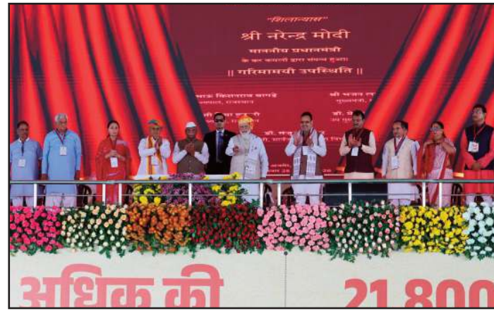
अधिक की 21,800

की ओर एक कदम है। बुनियादी ढांचे पर चर्चा करते हुए,