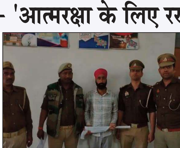
11:55 बजे मुखबिर की सूचना पर बलरामपुर-पूनापुर मार्ग पर

पोलीभीत। अवैध हथियारों पर अंकुश लगाने के अभियान में युंघचाई थाना पुलिस को बड़ी सफलता हाथ लगी। देर रात चेकिंग के दौरान एक युवक को तमंचे व कारतूस के साथ धर दबोचा गया। पूछताछ में आरोपी ने हथियार अपनी सुरक्षा के लिए रखने का दावा किया। पुलिस अधीक्षक के निर्देश पर युंघचाई पुलिस गश्त व वाहन चेकिंग में जुटी थी। 27 फरवरी रात करीब