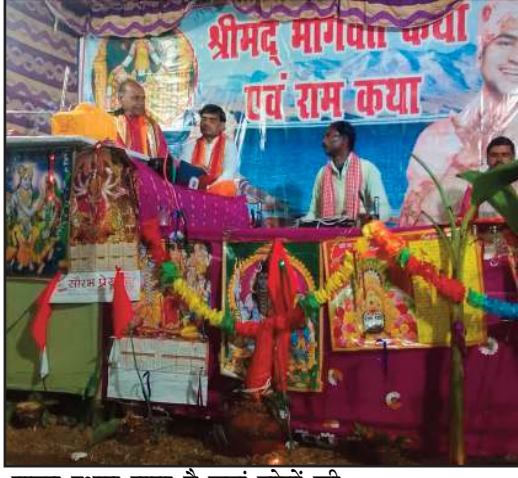
पावन स्थान माना है जहां लोगों की हर कामना पूरी होती है। कई भक्त

(जीएनएस)। हरदोई/मल्लावां वर्षों से चली आ रही परम्परा भक्तों की श्रद्धा से ग्राम मझिया जाफरपुर में एक फिर श्रीमद्भागवत का आयोजन श्री ब्रह्म देव बाबा स्थान पर चल रही कथा का आज अन्तिम दिवस है। ग्रामवासियों व क्षेत्रवासियों की हर वर्ष की मंशा के अनुसार सभी भक्त लोगों को एक बार फिर भागवत कथा को श्रावण करने का पावन अवसर मिला जिससे सभी भक्ति गणों के मन में प्रसन्नता बनी हुई है। जानकारी के अनुसार, ब्रह्म देव ग्राम मझिया जाफरपुर का एक पवित्र