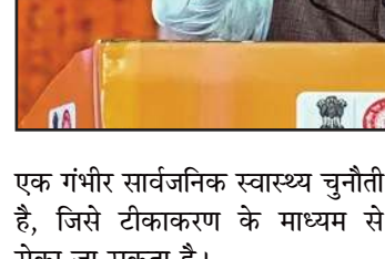
एक गंधीर सार्वजनिक स्वास्थ्य चुनौती है, जिसे टीकाकरण के माध्यम से रोका जा सकता है।

इस अवसर पर प्रधानमंत्री एक जनसभा को भी संबोधित करेंगे। करीब 16,686 करोड़ रुपये की विभिन्न विकास परियोजनाओं का लोकार्पण एवं शिलान्यास करेंगे। कार्यक्रम को लेकर प्रशासन और भारतीय जनता पार्टी के कार्यकर्ता तैयारियों में जुटे हैं। पीएम की रेली में भारी संख्या में समर्थकों के जुटने का अनुमान है।