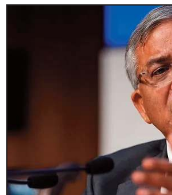
तरह मनाएं। 234 सीटें, 5.67 करोड़ मतदाता तमिलनाडु की 234 विधानसभा सीटों में 188 सामान्य, 44 अनुसूचित जाति और 2 अनुसूचित जनजाति के लिए आरक्षित हैं। 27 अक्टूबर 2025 से 23 फरवरी 2026 तक विशेष गहन पुनरीक्षण अभियान चलाया गया। आयोग का दावा है कि इस प्रक्रिया में मृत, स्थानांतरित या एक से अधिक

'कुडावोलार्ड' व्यवस्था का जिम्मा दिया गया, जो 10वीं सदी से प्रचलित थी। उन्होंने इसे राज्य की लोकतांत्रिक विरासत बताया और मतदाताओं से अपील की कि चुनाव को उत्सव की