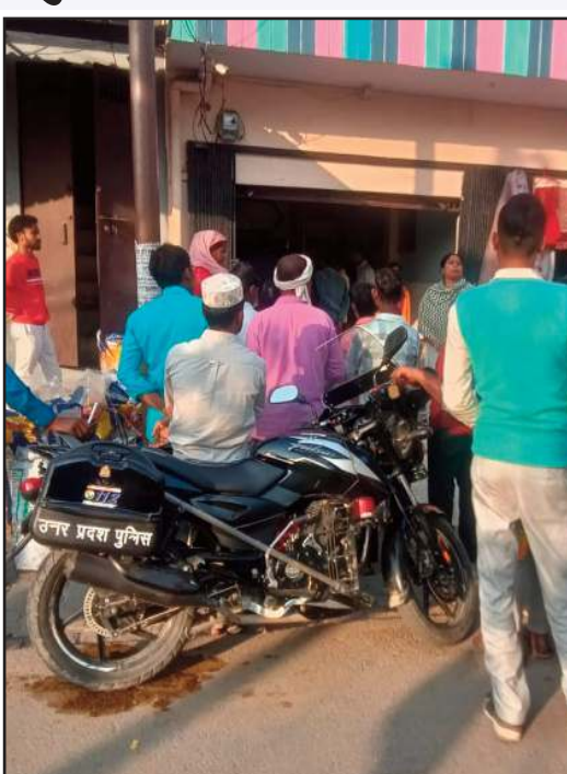
धक्का-मुक्की भी हुई, जिसके बाद दंपति को दुकान से बाहर जाने को

(जीएनएस)। बरखेड़ा (पीलीभीत)। नगर के स्टेशन रोड स्थित एक सुनार की दुकान पर गांठ बदलने के आरोप को लेकर गुरुवार को विवाद खड़ा हो गया। जानकारी के अनुसार स्टेशन रोड पर निसार किराना स्टोर के पास स्थित लाल जी की सुनार की दुकान पर एक गांव से आए पति-पत्नी अपनी गिरवी रखी गांठ छुड़ाने पहुंचे थे। बताया जाता है कि जब उन्होंने अपनी गांठ मांगी तो आरोप है कि सुनार ने उन्हें कम वजन की गांठ दे दी। इस पर दंपति ने आपत्ति जताते हुए कहा कि उनकी कमर की पेट्री करीब 250 ग्राम की थी, जबकि दी जा रही गांठ काफी हल्की है। इस बात को लेकर दोनों पक्षों के बीच कहासुनी हो गई। आरोप है कि विवाद बढ़ने पर गाली-गलौज और