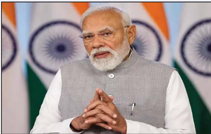
हैं। अब पीएम मोदी ने उनके ही नाम पर कांग्रेस पर तीखा हमला बोला।

में कांग्रेस को लगभग 99 प्रतिशत वोट और 400 से अधिक सीटें मिली थीं। इसके बाद हुए चुनावों में कांग्रेस का वोट शेयर लगातार गिरता गया। आज हालत यह है कि देश में केवल चार राज्यों में ही कांग्रेस के 50 से अधिक विधायक हैं।' राहुल गांधी अक्सर ही अपने भाषणों में जेन-जी से अपील करते रहे