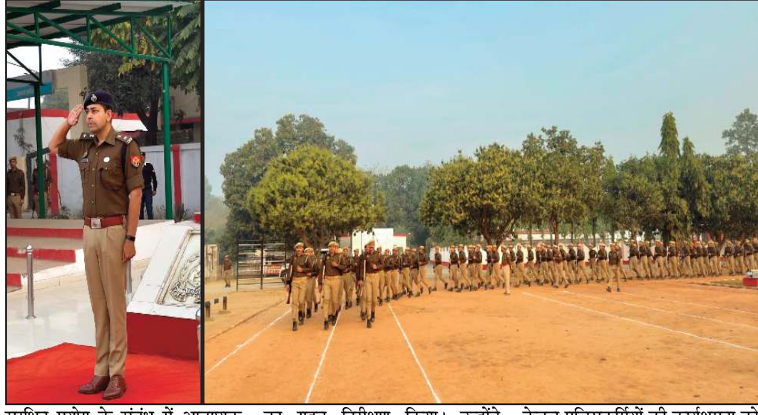
सुरक्षित प्रयोग के संबंध में आवश्यक निर्देश प्रदान किए गए, ताकि वे हमेशा तैयार रहें परेड समाप्त होने के उपरांत पुलिस अधीक्षक महोदय ने पुलिस लाइन परिसर में स्थित विभिन्न शाखाओं का गहन निरीक्षण किया। उन्होंने स्वच्छता बनाए रखने के लिए प्रतिस्तर निरीक्षण को कड़े निर्देश दिए, जिससे परिसर में अनुशासन और सफाई का स्तर उच्चतम बना रहे।

(जीएनएस)। जनपद पीलीभीत, पुलिस अधीक्षक पीलीभीत द्वारा रिजर्व पुलिस लाइन, पीलीभीत में आयोजित शुक्रवार की परेड की सलामी ली गई। परेड के दौरान सभी पुलिसकर्मियों को परेड कराई गई तथा शस्त्र ड्रिल भी कराई गई, जिससे उनकी अनुशासनबद्धता और तत्परता का प्रदर्शन हुआ इसके बाद महोदय द्वारा यूपी-112 की गाड़ियों (पीआरवी) का विशेष निरीक्षण किया गया। उन्होंने गाड़ियों के चालकों से वाहनों की किसी भी प्रकार की समस्याओं के बारे में विस्तृत जानकारी प्राप्त की। साथ ही, पीआरवी पर उपलब्ध जीवन रक्षक उपकरणों की उपलब्धता की जांच की गई। आपात स्थिति में इन उपकरणों के सही एवं त्वरित प्रयोग हेतु चालकों व कर्मियों को स्पष्ट दिशा-निर्देश दिए गए। इसके अतिरिक्त, सभी पुलिसकर्मियों को अपने शस्त्रों के सही रख-रखाव एवं