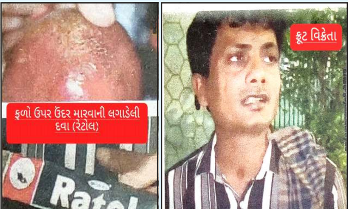
તો વળી કેટલાક જાગૃત અને સજાગ નાગરિકોએ પોતાની નજરો સામે આ જોખમી પ્રવૃત્તિ કરતાં જોઈને ફેરિયાઓને રંગે હાથ પકડ્યા અને એનો વિડીયો જનતા હિતમાં વાઈરલ કર્યો

રાત્રીના સમયે ઉંદરો ફળો ખરાબ ન કરે એટલા માટે એ ફળો ઉપર રેટોલ લગાડતા મલાડના ફૂટ વેચનારાઓ રંગે હાથ પકડાયા સલામતી વિશે ગંભીર પ્રશ્નો ઊભા થઈ રહ્યા હતા. આ બાબતે કેટલાક જાણકારોના જણાવ્યા મુજબ રેટોલમાં યલો ફોસ્ફરસ જેવા અત્યંત ઝેરી રસાયણો હોય છે જે માનવશરીર માટે જીવલેણ સાબિત થઈ શકે છે. આ ઝેર શરીરમાં પ્રવેશતા જ રક્તપ્રવાહમાં ભળીને ગંભીર નુકશાન પણ પહોંચાવી શકે છે. ખાસ ચિંતાનો વિષય છે કે આવા ઝેરી પદાર્થો ફળોની છાલમાં શોષાઈ જાય તો માત્ર પાણીથી ધોવાથી એનો પ્રભાવ સંપૂર્ણપણે દૂર થતો નથી. નાના બાળકો ઘણીવાર ફળોને સારી રીતે ધોયા વગર કે છાલ ઉતાર્યા વગર ખાઈ લેતા હોય છે. જેથી જોખમ વધી જાય છે. આરોગ્ય નિષ્ણાંતો ધ્વારા લોકોને ફળોને મીઠાવાળા હળવા ગરમ પાણીમાં ઓછામાં ઓછી ૨૦ મિનિટ સુધી પલાળી રાખવાની અને શક્ય હોય તો છાલ ઉતારીને જ ખાવાની સલાહ આપવામાં આવી છે. ફૂટ વિકેટ