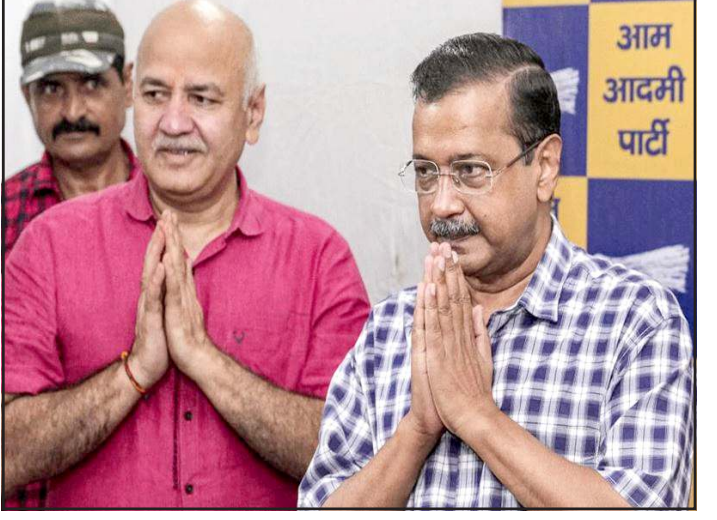
સિસોદિયા વિરુદ્ધ કેસ બનતો નથી. અત્યાર સુધીની સૌથી મોટી રાહત આ ચુકાદો આમ આદમી પાર્ટી માટે માનવામાં આવી રહી છે.

વિરુદ્ધ મામલો બનતો નથી. કોર્ટે ચાર્જશીટને નબળી ગણાવતા રાહત આપી છે. ઉલ્લેખનીય છે કે, આ મામલો ૨૦૨૨-૨૩ની દિલ્હી એક્સાઈઝ પોલિસી (દારૂ નીતિ) સાથે જોડાયેલો છે. આ મામલે સીબીઆઈએ કેસ નોંધ્યો હતો અને બાદમાં ઈડી(ED)એ મની લોન્ડિંગના આરોપમાં તપાસ શરૂ કરી હતી. આમ આદમી પાર્ટીના અનેક નેતાઓ આ કેસમાં જેલમાં ગયા હતા અને ઘણી વખત તેમની જામીન અરજીઓ ફગાવી દેવામાં આવી હતી. શુક્રવારે રાઉઝ એવન્યુ કોર્ટે સ્પષ્ટ કર્યું કે, પ્રથમ દ્રષ્ટિએ સીબીઆઈની ચાર્જશીટના આધારે કેજરીવાલ અને