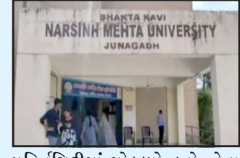
યુનિવર્સિટીમાં મોકલ્યો હતો, તેના આધારે યુનિવર્સિટીએ બીએડ કોલેજને વિદ્યાર્થી ફાળવી દીધા હતા એવા અણસાર મળતા હવે જવાબદારો વિરૂધ્ધ પોલીસ ફરીયાદ કરવાની માંગ ઉઠી છે. છેલ્લા ઘણા સમયથી આ સોરઠ પંચકની બીએડ કોલેજ બોગસ હોવાની રાવ સાથે મોટો વિવાદ સર્જાયો હતો. નરસિંહ મહેતા યુનિવર્સિટીમાં ઉપકુલપતિ બદલી જતા શંકાસ્પદ બન્યા બાદ નાંડોળા બીએડ કોલેજ એનસીટીઈ એ કોઈપણ પ્રકારની આધારે બે વરસથી ધમધમતી હોવાનો ઘટસ્ફોટ થયો છે. એનસીટીઈ એ કોઈપણ પ્રકારની મંજૂરી આપી ન હતી, જવાબદારોએ એનસીટીઈ ના નામે બોગસ મંજૂરી પત્ર તૈયાર કરી ગાંધીનગર ઉચ્ચ શિક્ષણ વિભાગ ને જુનાગઢ નરસિંહમહેતા

પ્રતિનિધિ, ગાંધીનગર ગુજરાતમાં થી નકલી પોલીસ, મંત્રીના નકલી પીએ, નકલી ઓફીસર, નકલી જજ અને નકલી સરકારી કચેરીઓ ઝડપાયા બાદ હવે ઉના તાલુકાના ભાયા ગામે ઇલ્લા બે વરસથી મંજૂરી વગર ધમધમતી નકલી બીએડ કોલેજ ઝડપાતા ભારે ખળભળાટ મચી જવા પામ્યો છે.