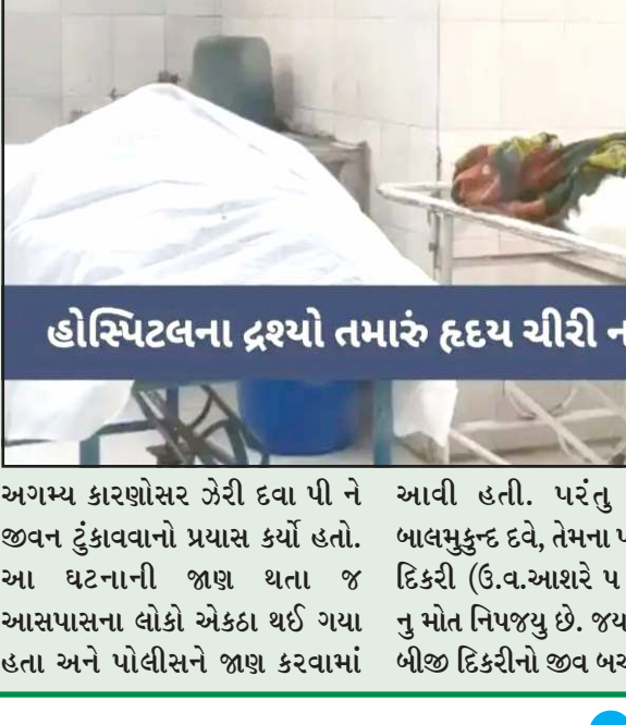
હોસ્પિટલના દ્રશ્યો તમારું હૃદય ચીરી નાંખશે!