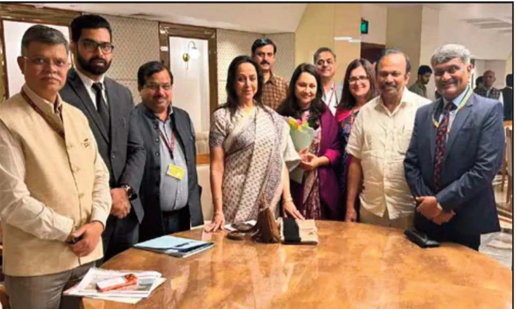
सड़कों निर्माण, जल निकासी और अन्य जन-समस्याओं के समाधान के

निगम क्षेत्र की वर्तमान मांगों और भविष्य के बजट की विस्तृत प्रस्तुति