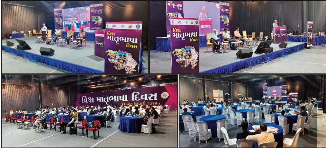
ताकि आमजन वैज्ञानिक शब्दावली को सरलता से समझ सकें।

एसटीईएम (साइंस, टेक्नोलॉजी, इंजीनियरिंग एंड मैथमेटिक्स) के अंतर्गत नए शोध में प्रयुक्त शब्दों का मातृभाषा में अनुवाद आवश्यक है,