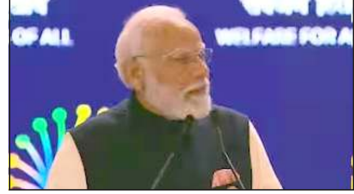
સમિટમાં યુવાનોની જબરદસ્ત પ્રશંસા કરતા પ્રધાનમંત્રીએ કહ્યું કે ભારતીય યુવાનો કૃષિ, સુરક્ષા અને દિવ્યાંગોને મદદ કરવા માટે AI નો ઉપયોગ કરી રહ્યા છે. તેમણે આને 'મેક ઈન ઈન્ડિયા' ની મોટી સફળતા ગણાવી. તેમણે ભારતીય યુવા પ્રતિભાને ટેકનોલોજી વિકસાવી રહી છે જે ફક્ત વ્યવસાય માટે જ નહીં પરંતુ સામાજિક સુધારાઓ માટે પણ અસરકારક સાબિત થશે.

વૈશ્વિક સ્થિરતા માટે મોટો ખતરો ગણાવ્યો હતો. તેમણે કહ્યું કે જેમ ખોરાક અને પીણાં માટે સલામતીના ધોરણો છે, તેવી જ રીતે ડિજિટલ વિશ્વમાં પ્રમાણિકતા લેખલ હોવા જોઈએ જેથી લોકો વાસ્તવિક અને ઈ-જનરેટેડ સામગ્રી વચ્ચે તફાવત કરી શકે. પીએમ મોદીએ ડિજિટલ વિશ્વમાં પારદર્શિતા અને વિશ્વાસ જાળવવા માટે ડિપેન્ડેન્સનો સામનો કરવા માટે વૈશ્વિક ધોરણો અને ઈ-નિર્મિત ટેકસ્ટ, ફોટા અથવા વિડિઓઝ માટે ફરજિયાત વોટરમાર્કિંગ અને સ્પષ્ટ સ્ત્રોત ધોરણો માટે હાકલ કરી.