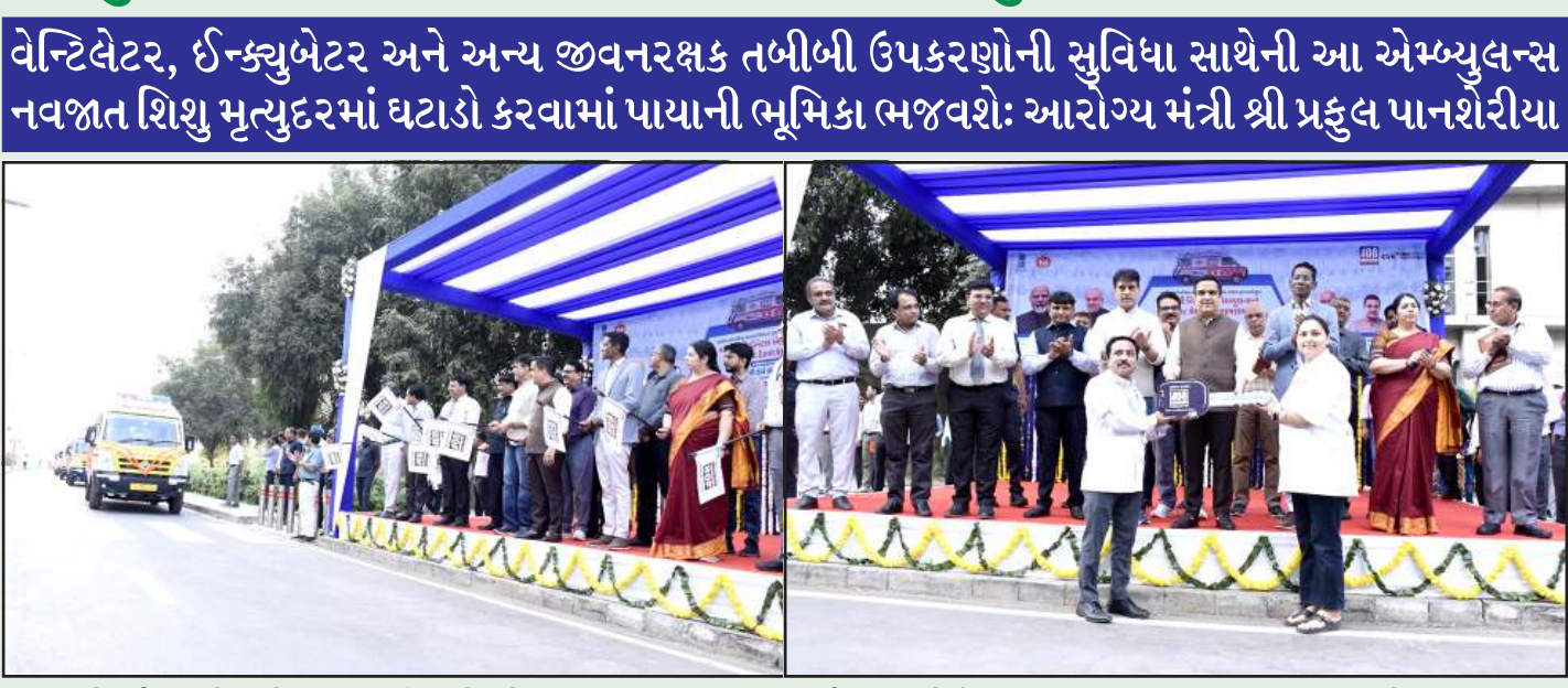
આ લોકાર્પણ પ્રસંગે આરોગ્ય મંત્રી શ્રી પ્રફુલ પાનશેરીયાએ જણાવ્યું હતું કે, રાજ્યના એક પણ બાળકનું આરોગ્ય સારવારના અભાવે મૃત્યુ ન થાય તે માટે સરકારે સંકલ્પ કર્યો છે. નવજાત શિશુઓ માટે સંજીવની સમાન આ નવી એમ્બ્યુલન્સ ખાસ કરીને ગંભીર હાલતમાં રહેલા નવજાત શિશુઓને એક હોસ્પિટલથી બીજી ઉચ્ચ સુવિધા ધરાવતી હોસ્પિટલમાં સુરક્ષિત રીતે લઈ જવા માટે તૈયાર કરવામાં આવી છે. આ એમ્બ્યુલન્સમાં વેન્ટિલેટર, ઈન્ક્યુબેટર અને અન્ય જીવનરક્ષક તબીબી ઉપકરણોની સુવિધા ઉપલબ્ધ રહેશે, જે રાજ્યના નવજાત શિશુ મૃત્યુદરમાં વધુ ઘટાડો કરવામાં પાયાની ભૂમિકા ભજવશે: આરોગ્ય મંત્રી શ્રી પ્રફુલ પાનશેરીયા

મુખ્યમંત્રી શ્રી ભૂપેન્દ્ર પટેલના નેતૃત્વમાં રાજ્યના આરોગ્ય અને પરિવાર કલ્યાણ વિભાગ દ્વારા નવજાત શિશુઓને સમયસર તેમજ સચોટ સારવાર મળી રહે તે માટે રાજ્ય સરકાર કટિબદ્ધ છે. જે અંતર્ગત આજે નાયબ મુખ્યમંત્રી શ્રી હર્ષ સંઘવીના હસ્તે અને આરોગ્ય મંત્રી શ્રી પ્રફુલ પાનશેરીયાની ઉપસ્થિતિમાં સ્વર્ણમ સંકુલ-૨, ગાંધીનગર ખાતેથી ૧૦૮ સેવા હેઠળ ૧૧ નવી અત્યાધુનિક 'નિયોનેટલ એમ્બ્યુલન્સ'નો લોકાર્પણનો કાર્યક્રમ યોજાયો હતો. આ પ્રસંગે રાજ્ય નાણા મંત્રી શ્રી કમલેશ પટેલ વિશેષ ઉપસ્થિત રહ્યા હતા. આ નવી ૧૧ અત્યાધુનિક 'નિયોનેટલ એમ્બ્યુલન્સ' સાબરકાંઠા, મહેસાણા, પાટણ, સુરત, ડાંગ, તાપી, જુનાગઢ અને રાજકોટ જિલ્લાના આરોગ્ય કેન્દ્ર ખાતે કાર્યરત કરવામાં આવશે.