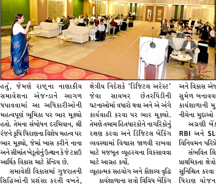
જેમણે રાષ્ટ્રના નાણાકીય સમાવેશના એજન્ડાને આગળ ધરાવવામાં આ અધિકારીઓની મહત્વપૂર્ણ ભૂમિકા પર ભાર મૂક્યો હતો. તેમના સંબોધન દરમિયાન, શ્રી રંજને કૃષિ ધિરાણના વિશેષ મહત્વ પર ભાર મૂક્યો, જેમાં ખાસ કરીને નાના અને સીમાં ખેડૂતોનું ઉત્થાન કે જે ટકાઉ આર્થિક વિકાસ માટે કેન્દ્રિય છે. સમાવેશી વિકાસમાં ગુજરાતની સિદ્ધિઓની પ્રશંસા કરતી વખતે,

ભારતીય રિઝર્વ બેંક (RBI)ના નાણાકીય સમાવેશ અને વિકાસ વિભાગ (FIDD), અમદાવાદ ક્ષેત્રીય કાર્યાલય દ્વારા આજે એકતા નગર સ્થિત ફર્ન સરદાર સરોવર રિસોર્ટ ખાતે ઉચ્ચ-સ્તરીય અભિસરણ કાર્યશાળાનું સફળતાપૂર્વક આયોજન કર્યું હતું. આ કાર્યશાળામાં ગુજરાત રાજ્ય અને દીવ, દમણ અને દાદરા નગર હવેલી કેન્દ્રશાસિત પ્રદેશ ના ૫૫ અગ્રણી જિલ્લા પ્રબંધકો (LDMs), ૧૮ જિલ્લા વિકાસ પ્રબંધકો (DDMs) અને અગ્રણી જિલ્લા અધિકારીઓ (LDOs) એ ભાગ લીધો હતો.