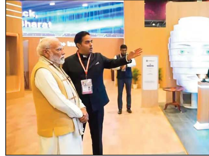
निजी क्षेत्र की बढ़ती भूमिका

तकनीक को सुलभ और समावेशी बनाना ही असली डिजिटल परिवर्तन