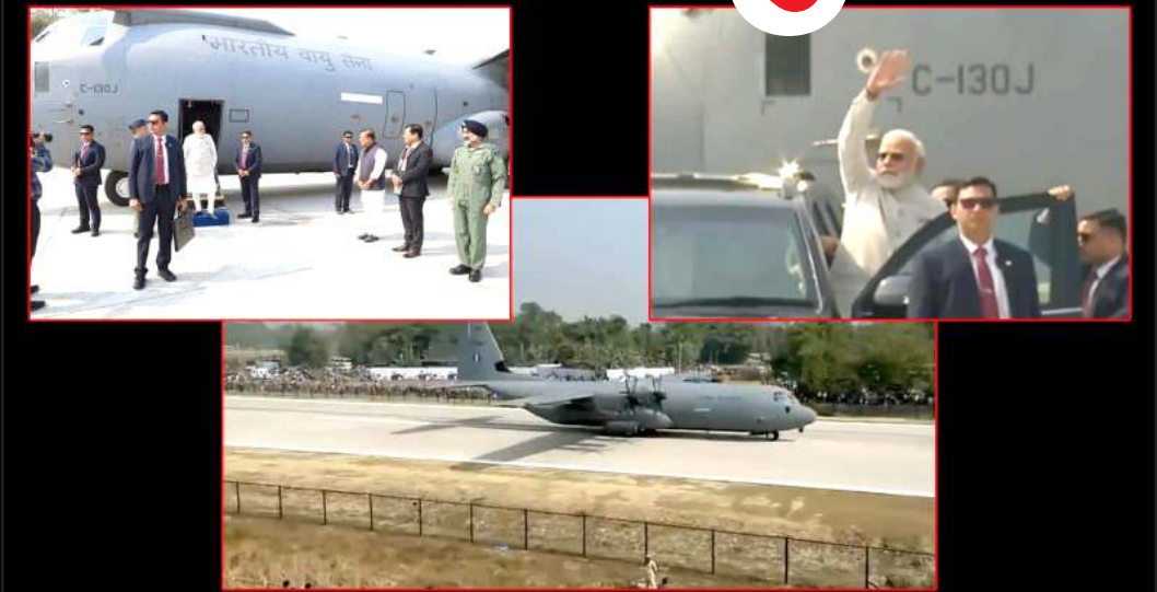
આકાશમાંથી સૈનિકોને ઉતારવાથી ઝડપથી કોઈપણ સ્થળે પહોંચાડી શકે છે. આ વિમાન સૈનિકો માટે જરૂરી વિમાનની મદદ લેવામાં આવે છે. આ સામાનની હેરફેર માટે પણ ઉપયોગી વિમાન મોટી સંખ્યામાં સૈનિકોને તજાવ દરમિયાન આ વિમાને લદાખમાં સ્થિત દુનિયાના સૌથી ઊંચા એરફીલ્ડ પર સૈનિકોને તહેનાત કરવામાં મદદ કરી હતી.

વાયુસેનામાં સામેલ કરવામાં આવ્યું હતું. ભારતમાં પહેલીવાર ૨૦૦૮માં અમેરિકન કંપની લોકહીડ માર્ટિન સાથે ૬ હરક્યુલિસ વિમાન માટે ડીલ કરી હતી. જે વર્ષ ૨૦૧૧થી પહેલા ડિલિવર થઈ ચૂક્યા હતા. જે પછી ભારતે આવા વધુ ૬ વિમાન માટે ઓર્ડર આપ્યું હતું, જે ૨૦૧૭થી ૨૦૧૯ વચ્ચે વાયુસેનામાં સામેલ થયા હતા. આ વિમાનના બેઝ ગાઝિયાબાદના હિંડન એરબેઝ અને પશ્ચિમ બંગાળના પાનાગઢમાં તહેનાત છે. આ વિમાન સ્પેશિયલ ઓપરેશનમાં પણ ખૂબ જ મદદરૂપ છે. સર્ચ અને રેસક્યૂ મિશનમાં પણ તેની મદદ લેવામાં આવે છે.