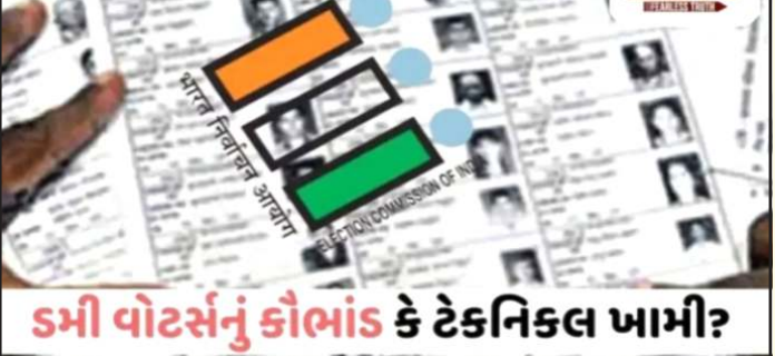
કમી વોટસંનું કૌભાંડ કે ટેકનિકલ ખામી?

પ્રતિનિધિ, ગાંધીનગર પશ્ચિમ બંગાળમાં એસઆઈઆર ની કાર્યવાહી દરમિયાન મતદાર યાદીમાં આશ્ચર્ય જનક બાબતો બહાર આવી છે. વીરભૂમિ જિલ્લાનો કિસ્સો તો ભારે ચોકવાચારો છે. નાનુર વિધાનસભા વિસ્તારમાં એક વ્યક્તિને ૩૮૯ મતદારોનો પિતા બતાવતા તે મુદ્દે કાર્યવાહીનો આદેશ આપવામાં આવ્યો છે. હાલના જિલ્લામાં પણ ૩૧૦ મતદારોના પિતા એક જ છે, એક જ જિલ્લામાં મતદારોના માતા પિતાનું નામ એક સમાન હોવાથી તપાસનો આદેશ આપવામાં આવ્યો છે. પશ્ચિમ બંગાળમાં એસઆઈઆર ની પ્રક્રિયા વખતે આવા કેટલાય કિસ્સા બહાર આવ્યા