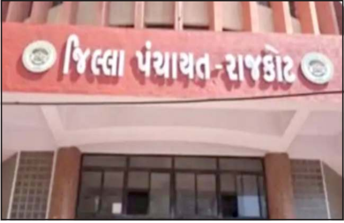
તલાટી કમ મંત્રી વિરુદ્ધ કાર્યવાહી કરશે. અન્ય સુચનામાં જણાવવાયું છે કે પંચાયતની સભા બેઠકમાં પતિદેવોની હાજરી હવે નહીં ચાલે, માત્ર ચુંટાયેલી મહિલા હાજર હોવી જોઈએ. ઉપરાંત પંચાયતના સરકારી રેકર્ડ

પ્રતિનિધિ, ગાંધીનગર રાજકોટ જિલ્લામાં ગ્રામ પંચાયતોમાં ચુંટાયેલી મહિલાઓની જગ્યાએ પતિદેવો દ્વારા વહિવટ ચલાવવામાં આવતો હોવાની ફરીયાદો મળતા જિલ્લા વિકાસ અધિકારીએ પંચાયતોના સત્તાધીશો વિરુદ્ધ લાલ આંખ કરી છે. આ બાબતે જ મુદ્દાઓ સાથે તમામ ગ્રામ પંચાયતોને પરીપત્ર મોકલવામાં આવ્યો છે. જિલ્લા વિકાસ અધિકારી દ્વારા પરીપત્રમાં સ્પષ્ટ કરવામાં આવ્યું છે કે ચુંટાયેલ મહિલા પ્રતિનિધિના બદલે પતિદેવ વહિવટ કરતા પકડાશે તો