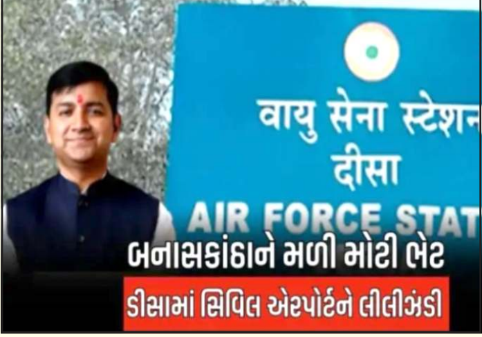
વાયુ સેના સ્ટેશન ડીસા બનાસકાંઠાને મળી મોટી ભેટ ડીસામાં સિવિલ એરપોર્ટને લીલીઝંડી

પ્રતિનિધિ, ગાંધીનગર બનાસકાંઠા જિલ્લાના વિકાસમાં આજે એક નવું સુવર્ણ પ્રકરણ ઉમેરાયું છે. થોડા દિવસ અગાઉ વિધાનસભાના અધ્યક્ષ શંકર ચૌધરી વાવ થરાદ જિલ્લાને થયું ઈન્ટરનેશનલ એરપોર્ટ મળશે તેવી વાતો કરી રહ્યા હતા. ત્યારે આ વાતોની વચ્ચે પ્રવીણ માળીના મત વિસ્તાર ડીસામાં એરપોર્ટ ને મંજૂરી મળી છે.